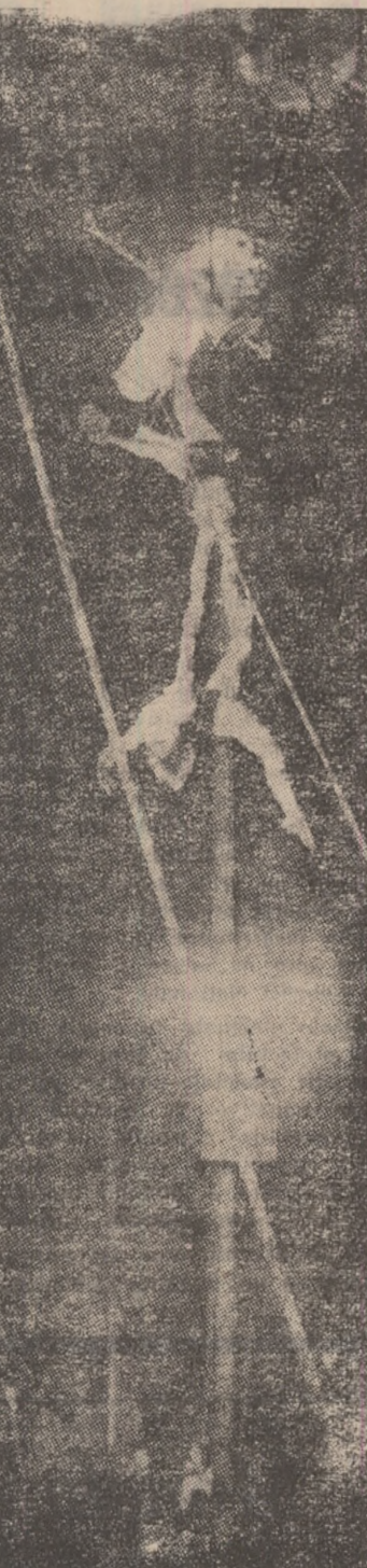
Un trușu număr de echilibrizată pe o structură înaltă.

Societatea franceză „Seqmafer” a prezentat recent specialiștilor o nouă mașină de nivelat și curățat. Mașina are lungimea de 43 m și înălțimea 138 t. Ea servește la introducerea și la repararea căilor ferate și se achită de această dublă sarcină cu o viteză fără precedent în anele căilor ferate. În timp ce mașina avansează, calea este ridicată de electromagnet, între boghiul din față și boghiul din spate. Dându-se ocazie pătrunderii sub cale și se montează platforma platformei. Balastul, pus în mișcare de benzi rulante și transportat pe trei etaje de curșuri, este curățat și epurat și apoi restituit din nou sub cale. Aceasta este apoi repusă pe platforma regenerată. Mașina poate parcurge astfel pînă la 2.000 m/h. Capacitatea ei de excavare și de încărcare orălă maximă este de 800 mc. Profundimea maximă de curățare a balastului este de 400 mm. Mașina este pusă în mișcare de un motor de 840 C.P.