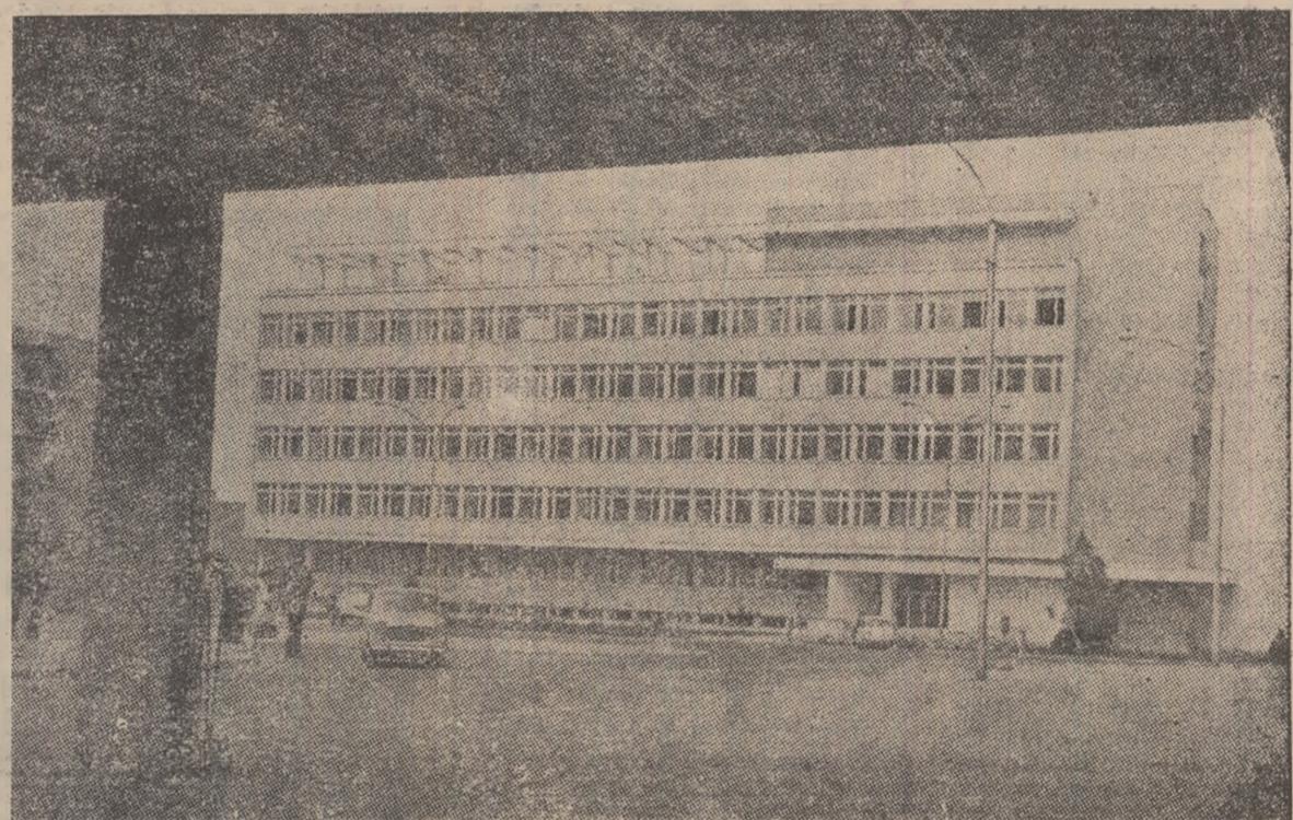
Modernă clădire care găzduțește D.S.A.P.C. din Deva.

Comandamentul unității de pionieri de la Școala generală nr. 2 lupeni organizează cu regularitate excursii pe diferite teme: istorice, geografice, de științe naturale, de orientare turistică. Astfel, în data de 5 mai, elevii de la această școală au fost în excursie la Tg. Jiu unde au vizitat muzeul județean precum și operele marilor sculptori Brâncuși, iar duminică 12 mai, elevii școlii au fost la vizită la Muzeul minierului din Petrosani.