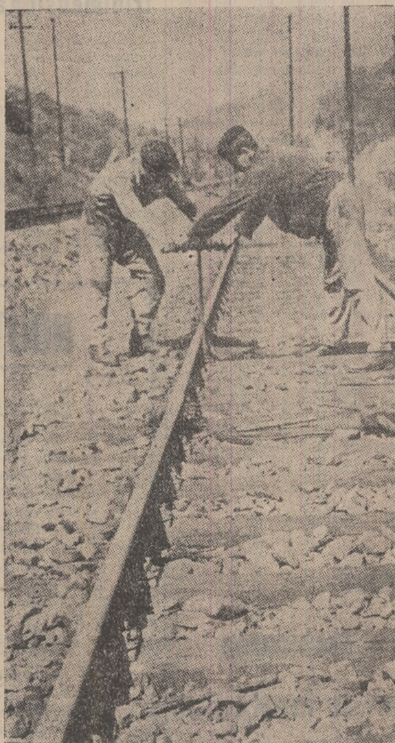
La întîrțirea drumului de fier.