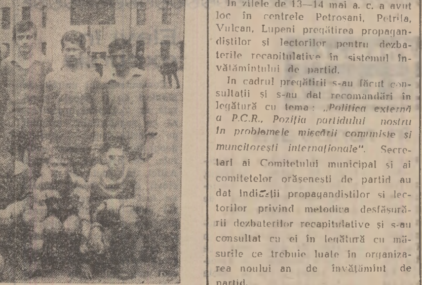
Copiii din Hațeg cu trofeele lor după câștigarea campionatului de fotbal rezervat copiilor.

Copiii din Hațeg îndrăgesc fotbalul. În orașul Hațeg a fost organizat un campionat de fotbal rezervat echipelor de copii care nu au depășit vârsta de 14 ani. S-au disputat în totalitate 8 echipe. Iată rezultatele înregistrate: Vîlitorul — Progresul 2-1; Zorile — Gloria 4-0; Retezatul — Răcheta 2-0; Steana — Rapid 6-5; Zorile — Vîlitorul 3-0; Steana — Retezatul 1-0; Zorile — Steana 4-3.