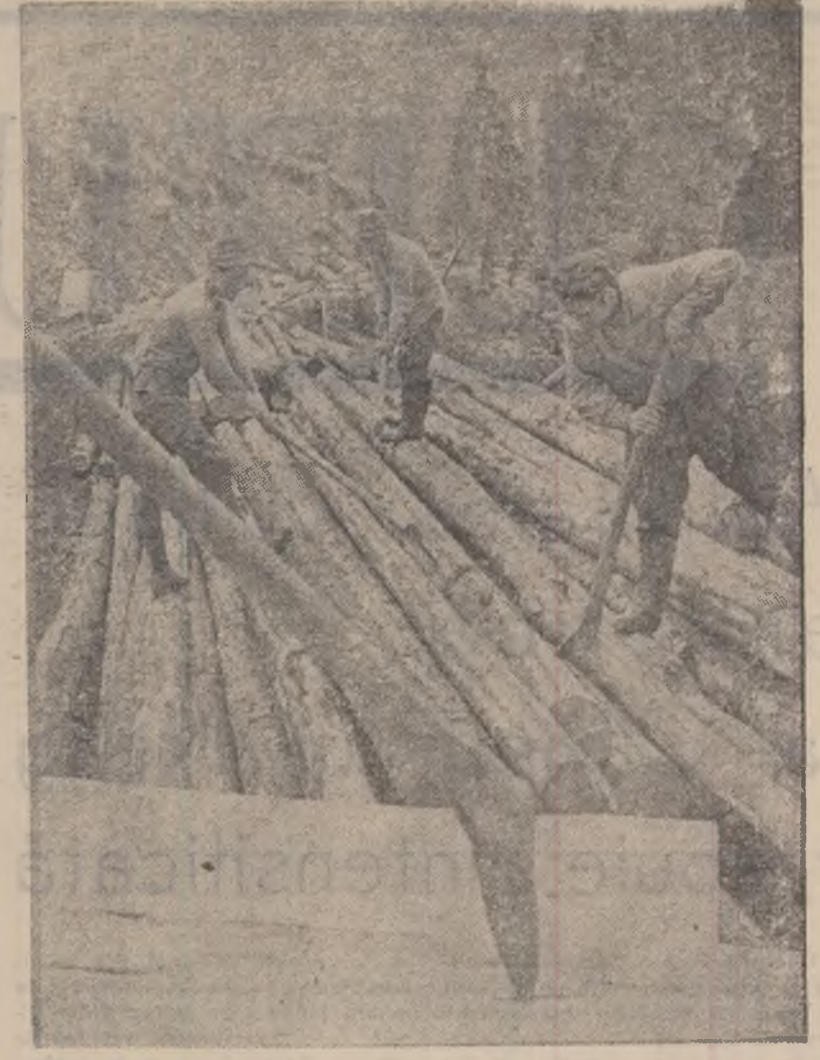
Zor pe rampa exploatarii forestiere Jiej.