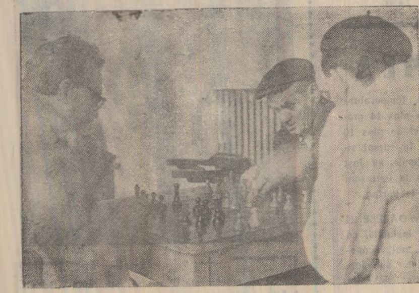
În timpul liber, la Clubul sindicatelor din Lupeni