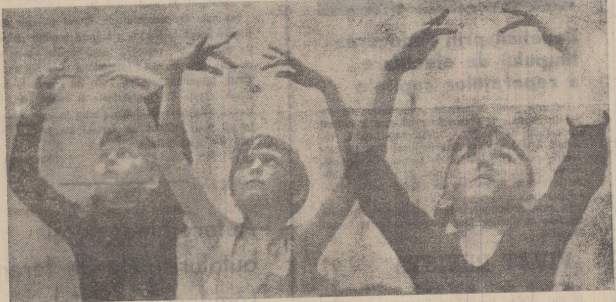
Primi „pași” în însușirea lănelor grației și corectitudinii. În cilșeu: la o oră de repetiții, în cercul de balet de la Casa de cultură din Petroșani.

proape 20 de ori. Din cauza deplasărilor tectonice, Carpații presează asupra marginii frontale a platoului est-european pe care îl deformează. De-a lungul fisurilor de contact de solicitare și de rupe, în care este cuprinsă și regiunea Cernăuți, se găsesc ca într-un lanț, epicentre de cutremure, printre care și regiunile seismice din Munții Vrancea, situate pînă la o adîncime de 200 km sub nivelul suprafeței pămîntului.