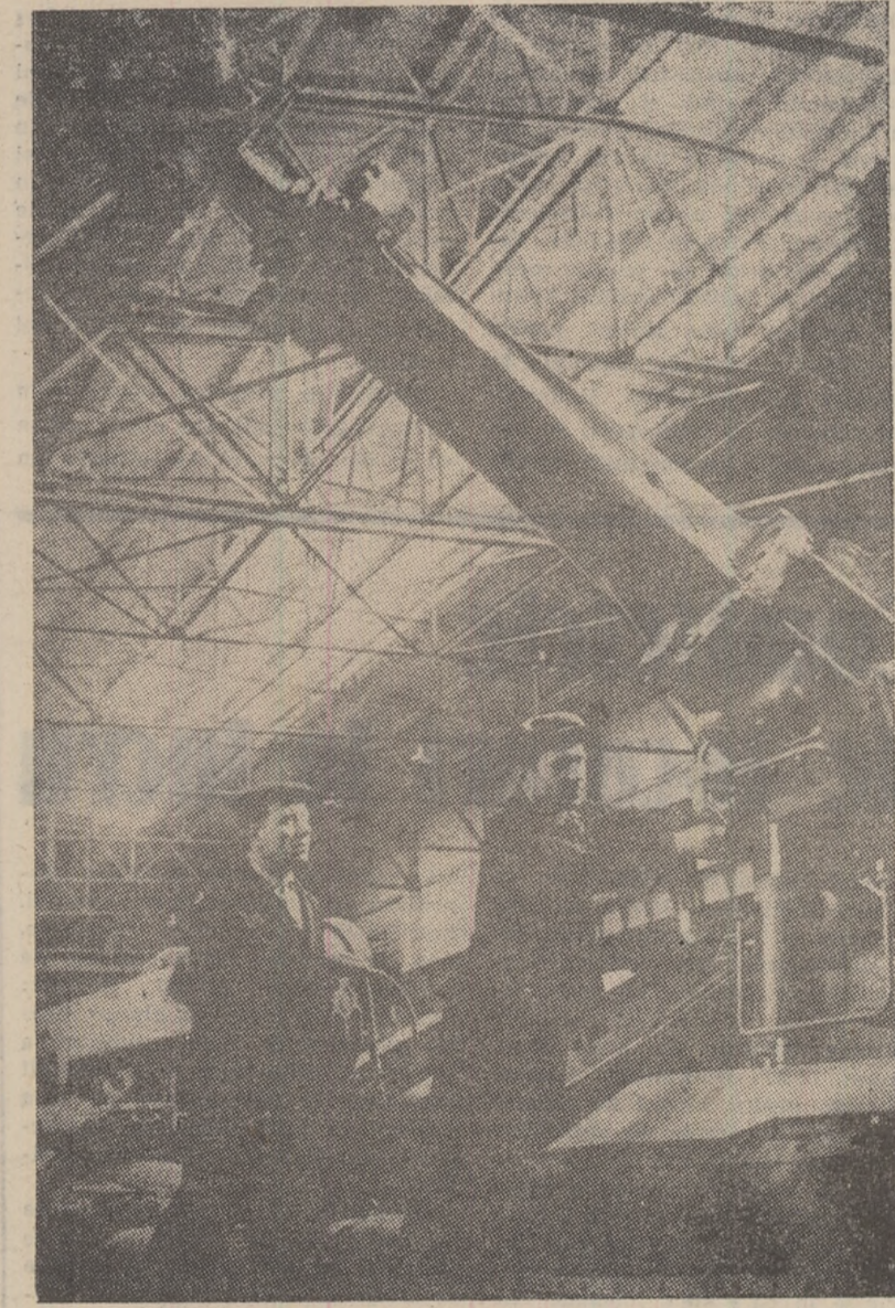
U.R.S.S.: Uzina constructoare de mașini din Kopeisk exportă producția sa — mașini miniere — în numeroase țări ale lumii. ÎN CLIȘEU: Asamblarea unei combine miniere „PK-ZM” la Uzina constructoare de mașini din Kopeisk, regiunea Celesbinsk, destinată exportului.

PARIS. — Corespondentul Agerpres, Al. Gheorghiu, transmite: Numărul oamenilor muncii din Franța aflați luni în grevă se ridică la circa 8 milioane, după date furnizate de sindicate. Din aceleași surse se anunță că greva va dura cel puțin 8 zile. Aproape 250 de mari uzine și întreprinderi sînt deja ocupate de greviști. Cu toată amploarea greve-