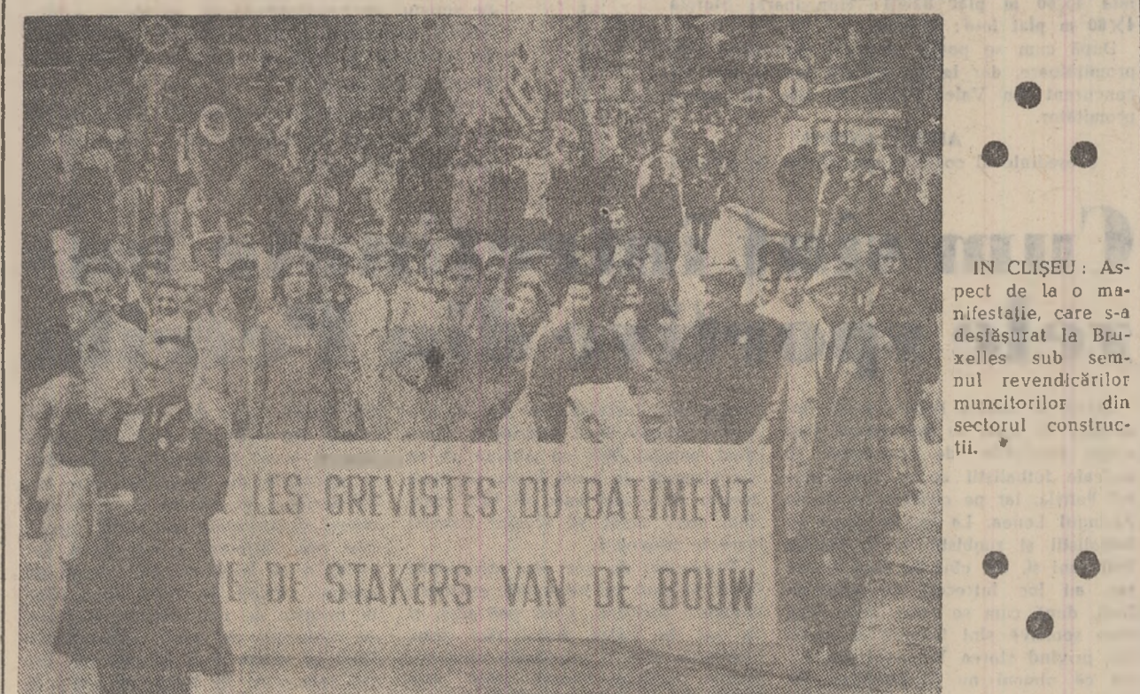
IN CLIȘEU: Aspect de la o manifestație, care s-a desfășurat la Bruxelles sub semnul revendicărilor muncitorilor din sectorul construcțiilor.

TOKIO. — Un nou cutremur de pămînt, de intensitate medie, a fost înregistrat marți dimineața în regiunea de nord a Japoniei. Epicentrul său a fost localizat în Marea Ochotsk, la aproximativ 400 km nord de insula Hokkaido. Cutremurul a fost resimțit în orașele Sapporo și Aomori, fără să fie înregistrate pagube.