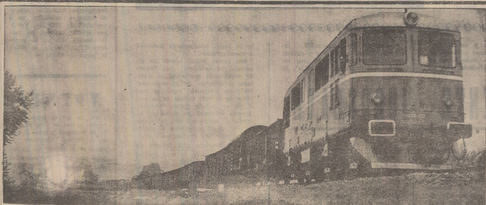
Încă una din sutele de garnituri care poartă aurul negru spre gurile de foc ale Hunedoarel.