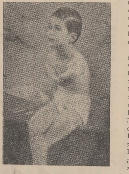
O VICTIMĂ A THALIDOMIDEI...

Acuzații se fac vinovați. Intre altele, că au produs și pus în vânzare un medicament fals, căruia, pentru a obține cistiguri fabuloase, i-au făcut o publicitate exagerată. Se fac vinovați, de asemenea, că au ignorat constatării unor medici, potrivit cărora administrarea Thalidomidei provoacă prurit, transpirație frison, slăbi vomitive, leșin și chiar paralizia membrilor. Totodată, procuratura din Aachen acuză firma „Chemie-Grünenthal” și pe principalii colaboratori ai acesteia, deși au fost incunoscînții de consecințele grave, au refuzat să lucreze la producția și vânzarea Thalidomidei.