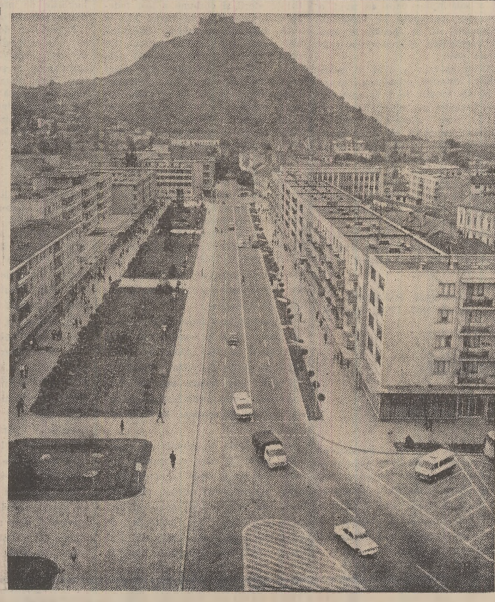
Centrul orașului Deva. În depărtare se profilează dealul Cetății.

Nicolae PLOPEANU Correspondentul Agerpres la Belgrad (Continuare în pag. a 4-a)