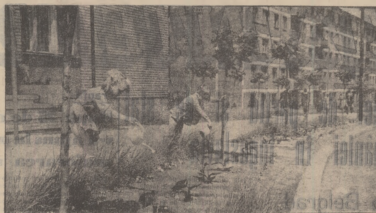
Nouă, fetițelor, ne plac florile. De aceea le dăm mereu pe cele din fata blocului nostru.

Conf. AUREL POP cadru de științe sociale I.M.P.