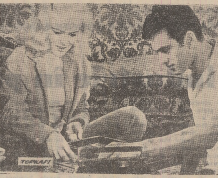
O secvență din filmul „Topkapi”

Transpunere pe ecran a romanului lui Eric Ambler „Lumina zilei”, filmul american „Topkapi” este o peliculă de aventuri prin excelență. Elisabeth (Melina Mercouri), o excentrică internațională, organizează împreună cu amantul său Walter (Maximilian Schell), spargerea muzeului Topkapi din Istanbul, pentru a lura un vestit pumnal cu mineral fierăstos cu pietre prețioase. Operațiunea este minujios pregătită. Seful Arthur Simpson (Peter Ustinov), atras în acțiune fără să știe, va trebui să introducă în Turcia tot materialul necesar. Simpson este interceptat însă la frontieră și poliția, care crede că este vorba de niște terorisți, urmărește banda pas cu pas. După nenumărate peripeții, datorită harului Elisabeth și vicleniei lui Walter, spargerea reușește. Dar două geșeli, în aparență neînsemnate, vor duce totuși la capturarea spărgătorilor. În închisoare, unde se pîștesse de moarte, Elisa-