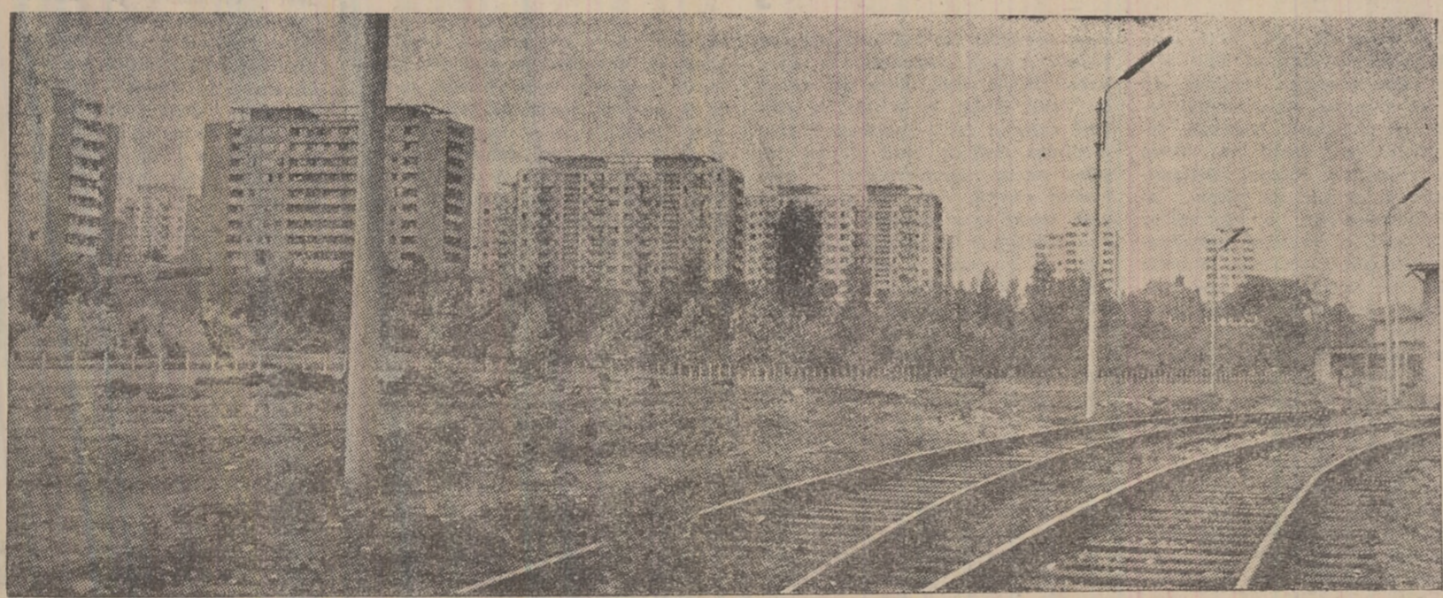
PANORAMIG VULCANEAN. 21 blocuri înalte, cu linii moderne, străjuiesc intrarea în oraș.