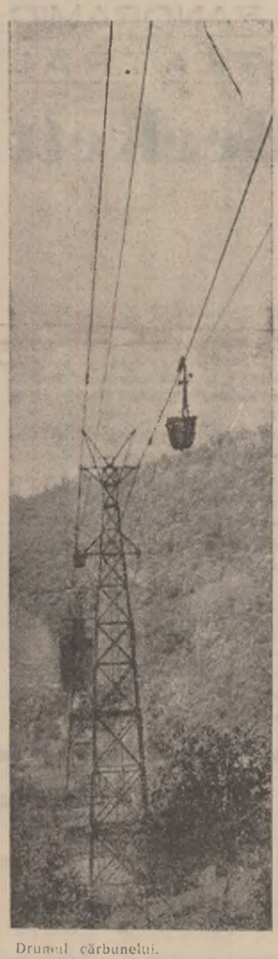
Drumul cărbunelui.