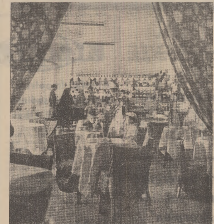
Un local amenajat cu gust unde poți servi într-un cadru intim și plăcut produse delicioase: cofetăria „Corso” din Lupeni.