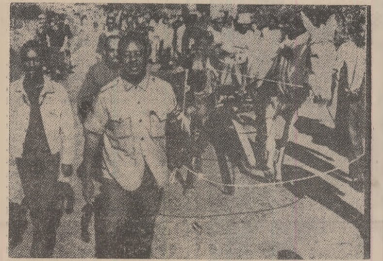
S.U.A.: Aspect din timpul trecerii prin orașul Edwars a „marșului săracilor” spre Washington; în frunte, noul lider al mișcării neviolente a populației de culoare din S.U.A., reverendul Ralph Abernathy.

propunerile formulate de secretariatul Commonwealthului, iar o nouă propunere care preconizează constituirea unei federații nu s-a bucurat de o primire mai bună decît cea referitoare la încetarea focului fără o renunțare prealabilă la secesiunea Biafel.