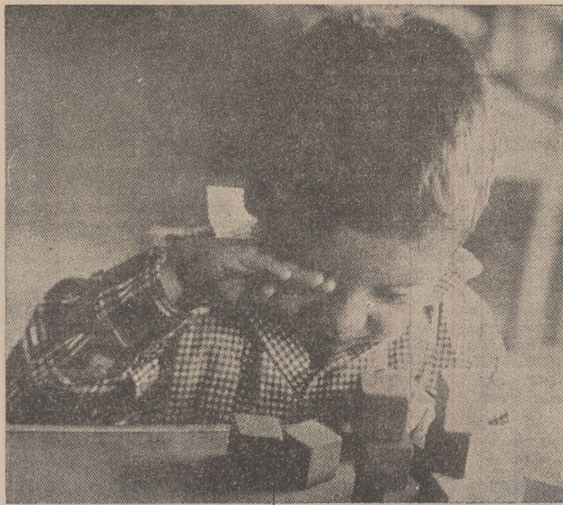
La o grădiniță de copii din Tegucigalpa, capitala micului stat Honduras din America Centrală.

După cum s-a mai anunțat, la Universitatea din Dakar au avut loc în urmă cu două zile incidente între studenți și forțe polițienești. Consiliul universității a hotărît să examineze împreună cu reprezentanții studenților greviști posibilitățile de a se soluționa criza.