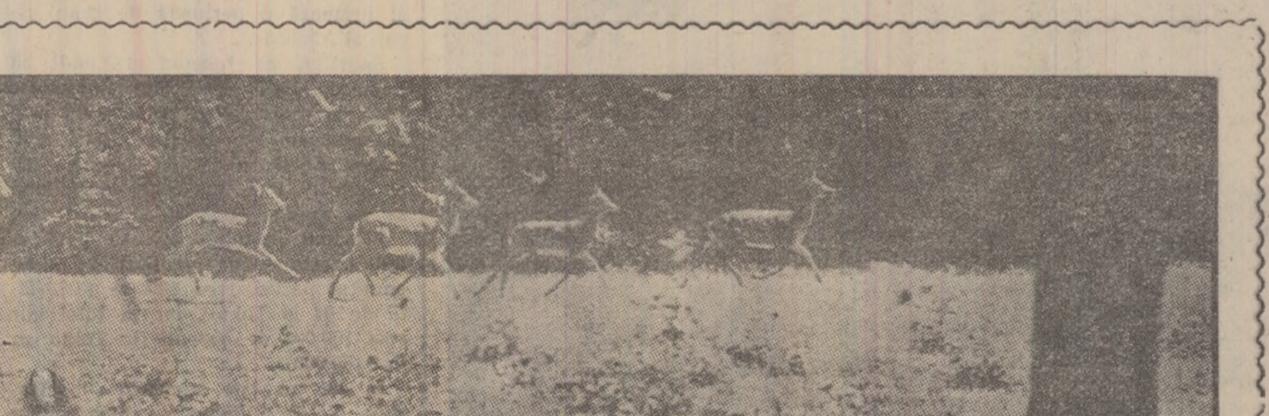
Căprioare în grădina zoologică din Simeria.

Cu toate că se hrănesc numai cu pește, focile nu pot avea o influență dăunătoare asupra rezervelor de pește de pe litoralul Mării Negre. Vînoarea focilor este absolut interzisă și Golful Gallacre — principalul adăpost al lor — a fost declarat rezervă.