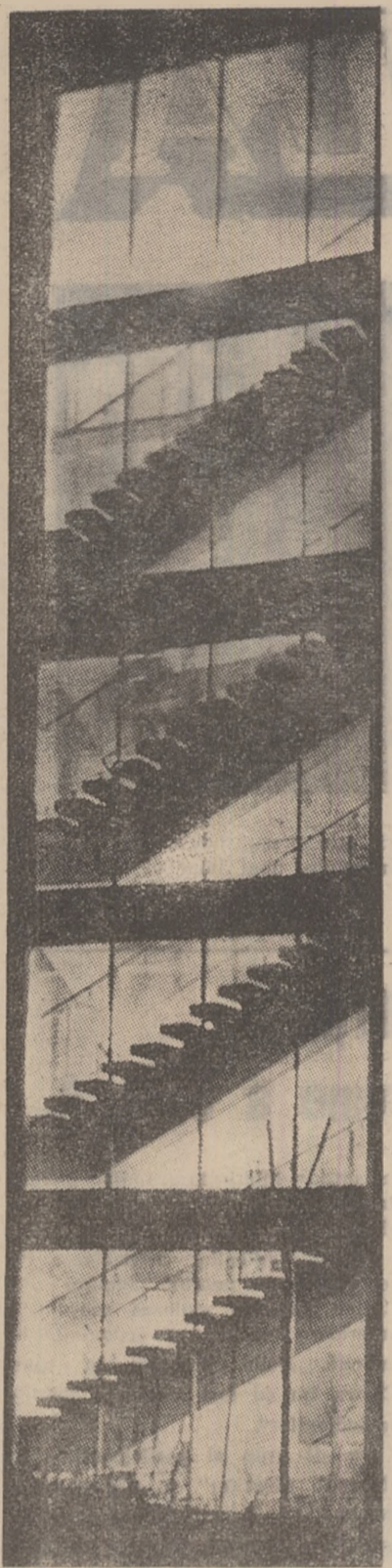
FASCINANTE GEOMETRII ARHITECTONICE — trepte spre confort și intimitatea locuinței.