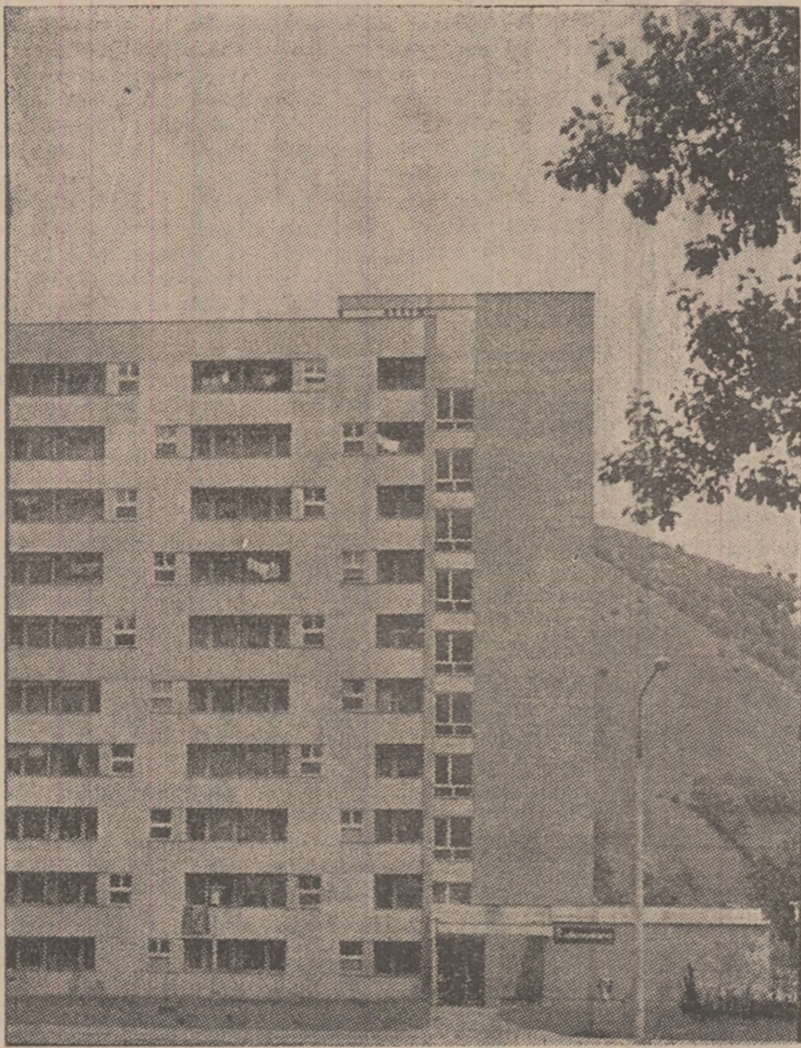
Blocul 13 din Petrol.