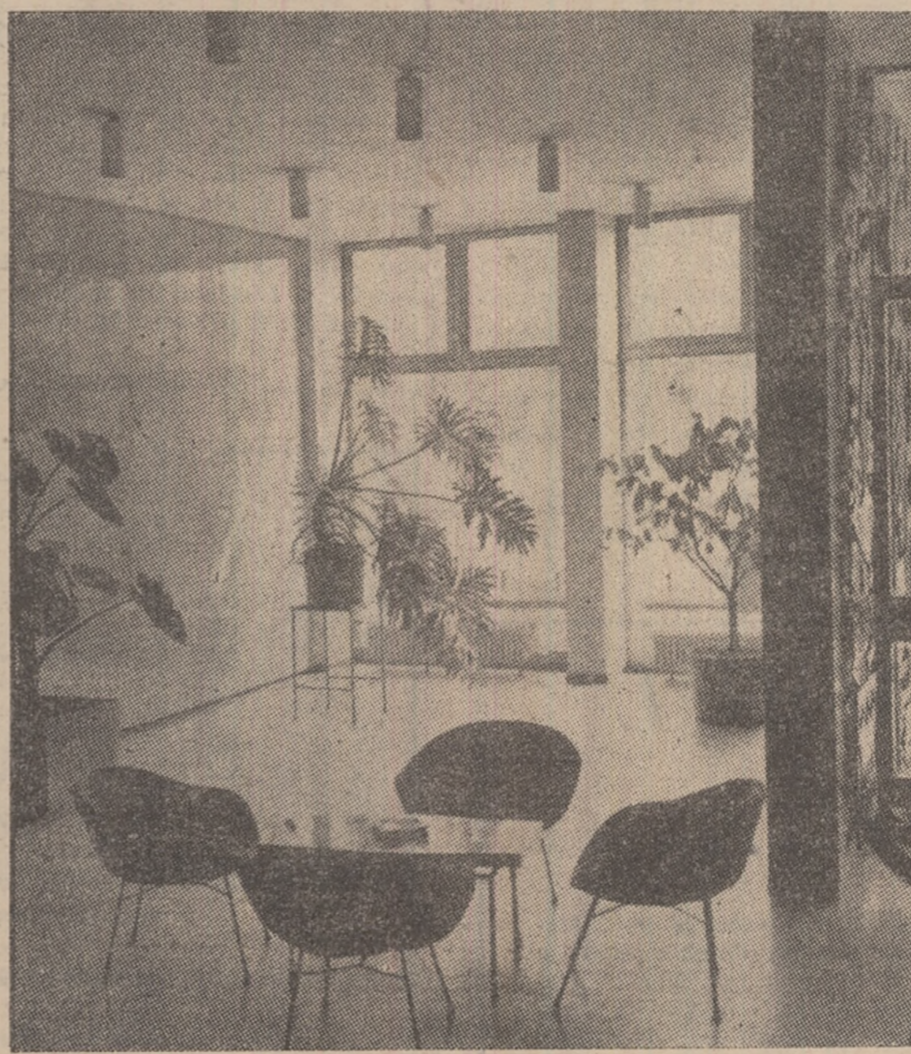
Un colț agreabil de la Casa de cultură a sindicatelor din Petrosani.

Pionierilor și școlărilor care își vor petrece vacanța în orașele sau comunele natale, școlile și organizațiile U.T.C. le vor oferi numeroase posibilități de odihnă și recreere, organizînd competiții sportive, serbări cîmpenești, jocuri de tabieră, drumetii, cluburi.