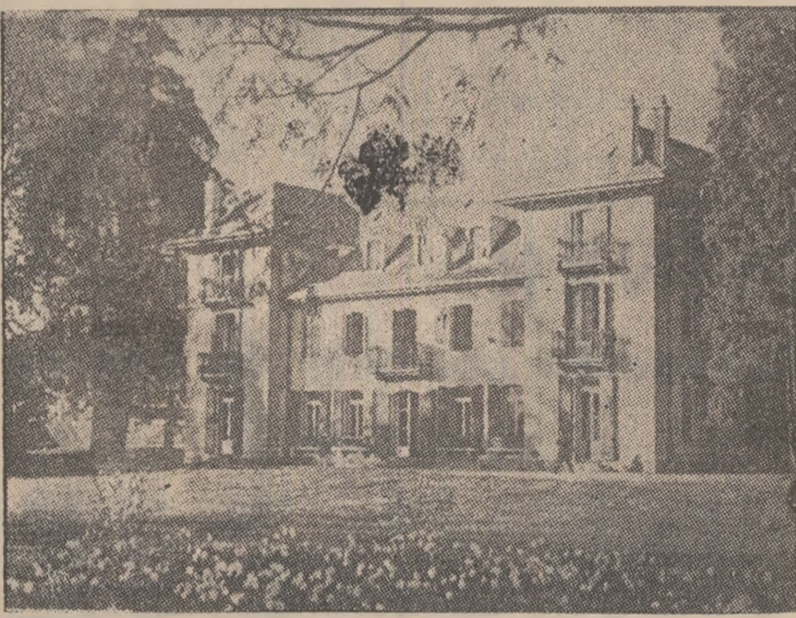
ELVEȚIA: În aprilie a. c. Comitetul olimpic internațional s-a mutat într-o nouă clădire — în „Chateau de Vidy”, situată în parcul pitoresc de pe malul Lacului Geneva de la marginea orașului Lausanne. În CLIȘEU: Noua clădire a Comitetului olimpic internațional „Chateau de Vidy”.