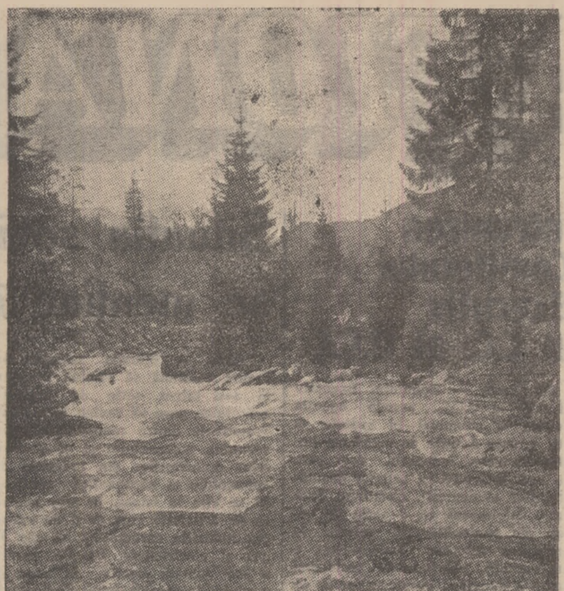
Peisaj de pe Valea Jiului.