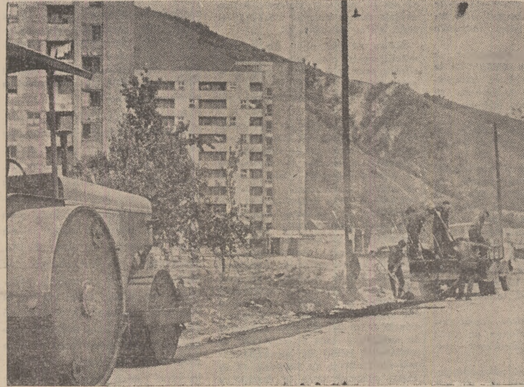
Pe sezoana principală din Petrița, o echipă specializată de asaltatori reface asfaltul în dreptul noii curții de blocuri „8 Martie”.