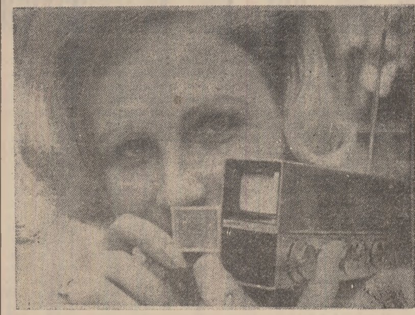
R. F. a GERMANIEI: Recent la Hamburg a fost prezentat de către o firmă japoneză cel mai mic televizor din lume. Ecranul său nu depășește dimensiunile unei mărci poștale.