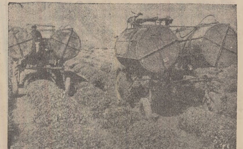
U.R.S.S.: R.S.S.A. Adjară. Bogăția de bază a colhozului „Karl Marx” din raionul Kobuleti, este ceaiul. O bună parte din lucrările se efectuează aici cu mașinile. ÎN CLISEU: Pe planșele de ceai ale colhozului Kobuleti.

Submarinul a dispărut la 21 mai între Insulele Azore și portul Norfolk (statul Virginia). În timp ce se întorcea la bază după ce participase la manevre în Mediterană, Marina militară americană a mobilizat o întregă flotă pentru căutarea submarinului, care nu a putut fi găsit.