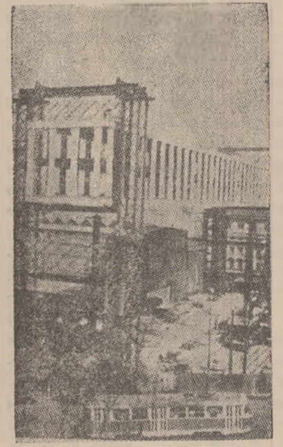
R. S. CEHOSLOVACA: Aspect al șantierului din piața Wenceslas din Praga unde se construiesc noua clădire a Adunării Naționale.

Plenara a adoptat noul proiect de program al sindicatelor și declarația Consiliului Central al Sindicatelor în legătură cu situația sindicală în cadrul întreprinderilor socialiste. A fost adoptată, de asemenea, o hotărâre cu privire la modificări de structură în cadrul sindicatelor, care să lăsa seama de principii ca fiecare întreprindere să-și aibă o organizație a mișcării sindicale revoluționare, respectându-se în același timp criteriul grupării sindicalelor pe ramuri profesionale. La plenară au fost hotărâte unele schimbări de cadre în Prezidiul și Secretariatul C.C.S.