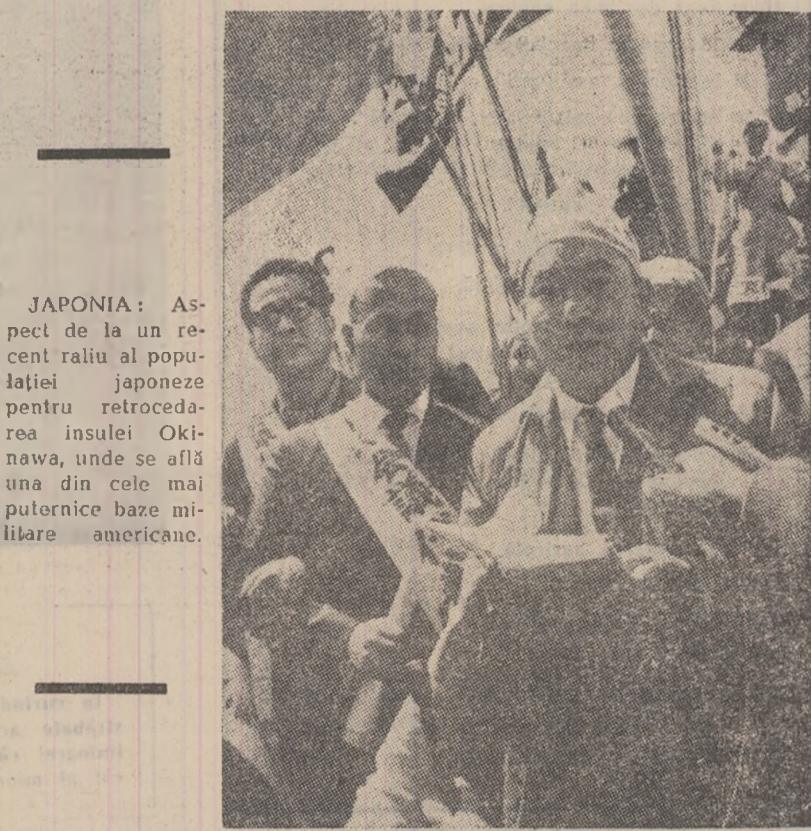
JAPONIA: Aspect de la un recent raliu al populației japoneze pentru retrocedarea insulei Okinawa, unde se află una din cele mai puternice baze militare americane.

La încheierea vizitei, președintele Alphonse Massamba-Debat a consemnat în cartea de onoare a muzeului cuvinte elogioase la adresa organizatorilor acestei originale instituții culturale.