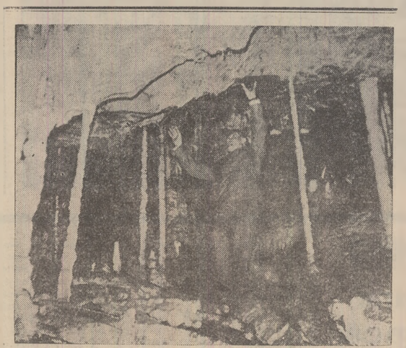
Interiorul peșterii cu stalactite de la Attenda (munții Sauerland), care a fost descoperită în anul 1907 și care de atunci atrage numeroși vizitatori.