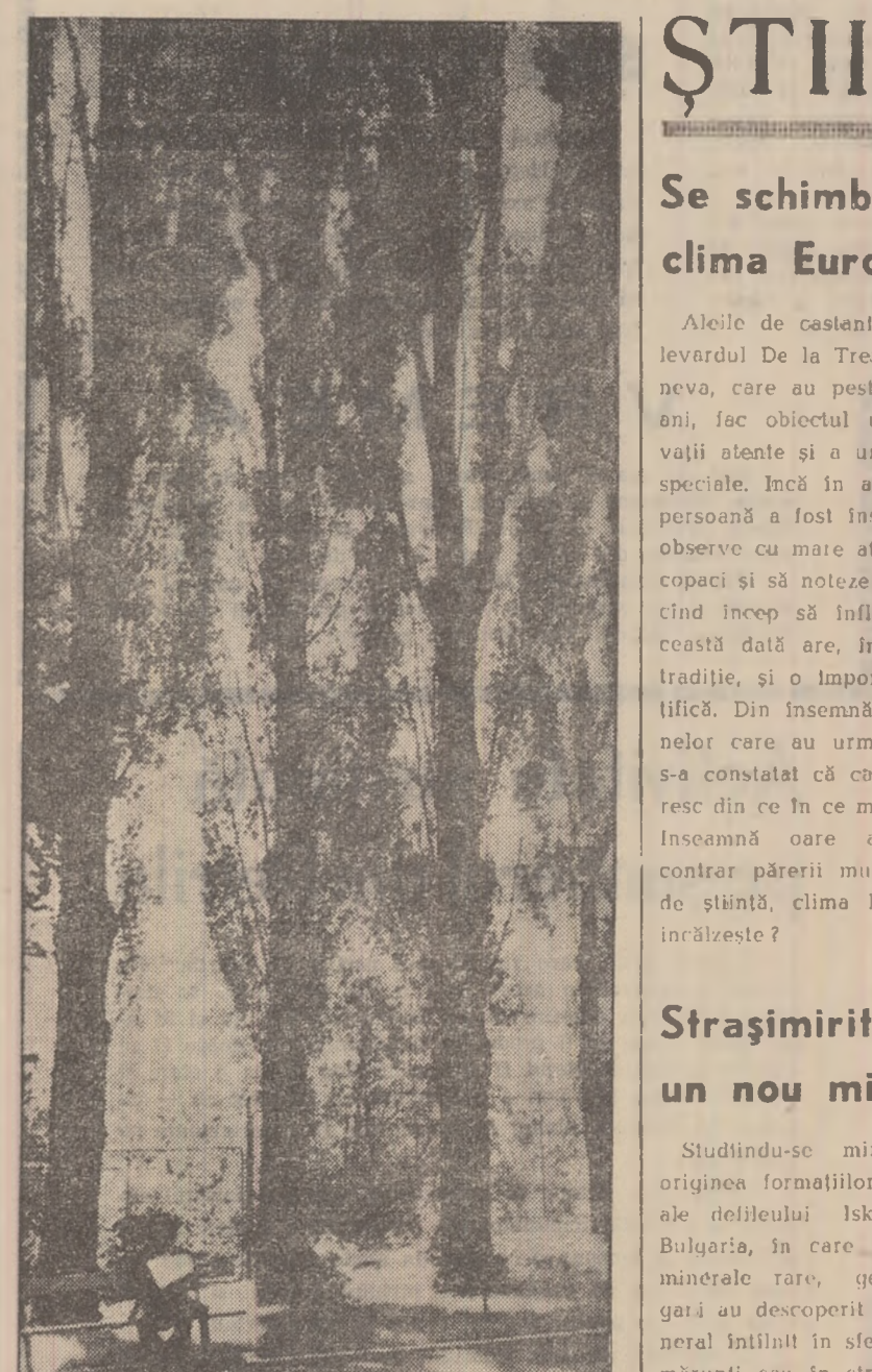
Lectură la umbra ploilor

— Nu o mai primeșc această. Fa-ta aceasta mi-s făcut proa multe,