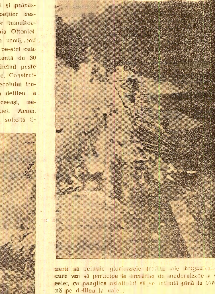
merii să revină glorioasele tradiții ale brigăzilor, care vor să participe la lucrările de modernizare a șoselei pe defileu la Valea Jiului.