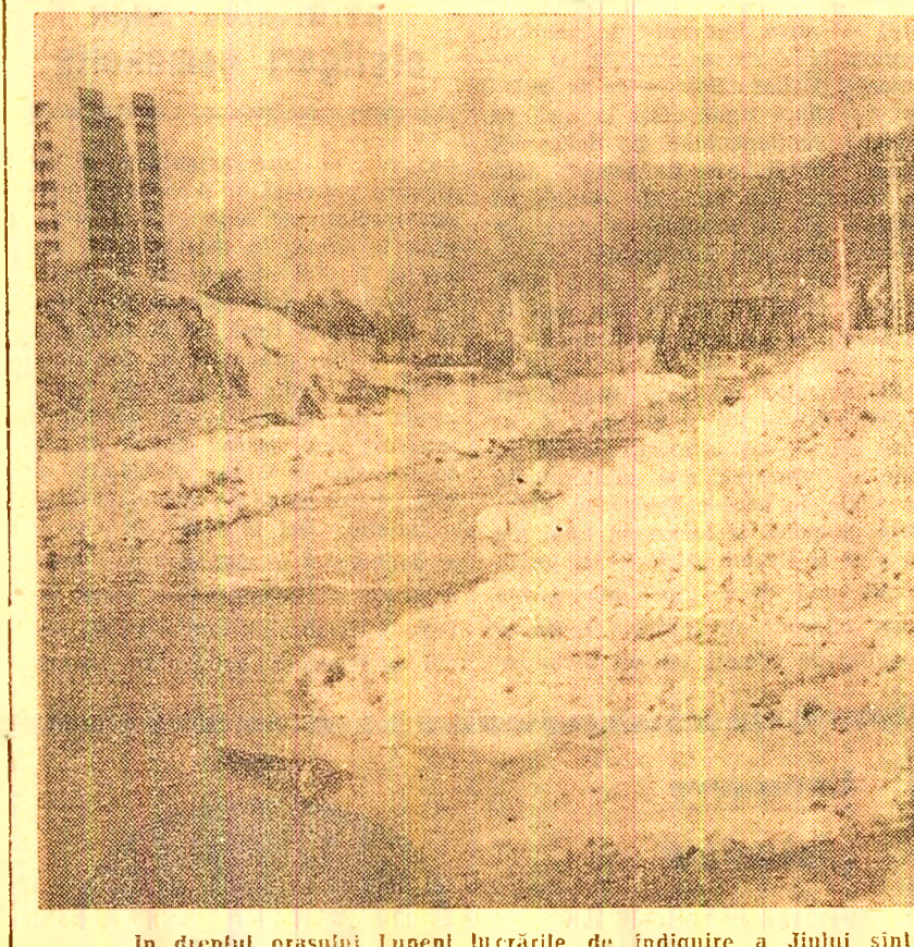
În dreptul orașului Lupeni lucrările de îndignire a Jiului sînt într-o fază înaintată.