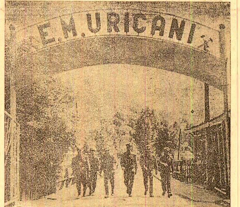
La mina Uricani înainte de începerea șutului.