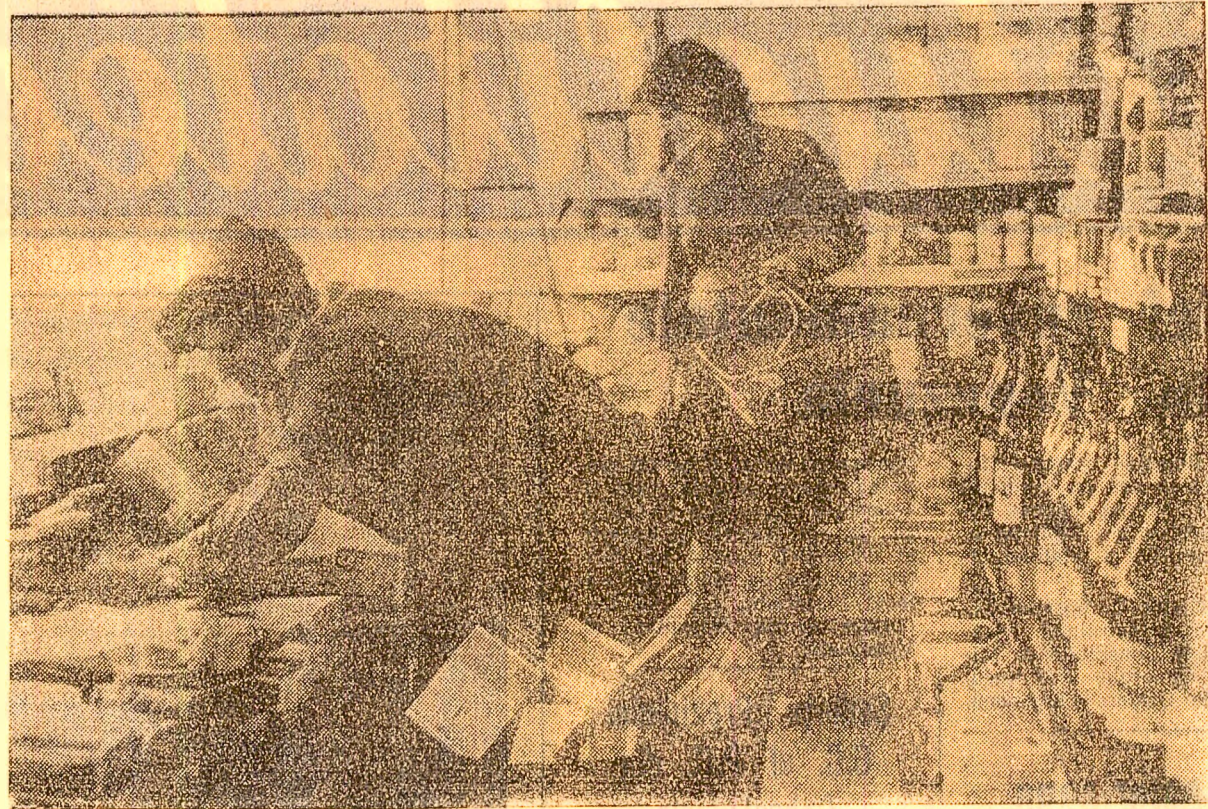
Magazinel cu autoservire din orașul Petrița își întâmpină zilnic cumpărătorii cu rafturile încărcate, amenajate cu gust.

Cabinetul pentru probleme de organizare științifică a producției și a muncii — în sprijinul activității întreprinderilor din municipiul Petroșani