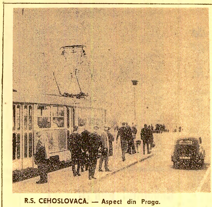
R.S. Cehoslovacă. — Aspect din Praga.

Prezidiul consideră necesar să se pregătească Congresul al XIV-lea extraordinar al P.C.C. și a discuta directivele politice ale sistemului juridic-statal al R.S.C. legea privind sistemul federativ al Cehoslovaciei urmând să fie adaptată în preajma aniversării a 50 de ani de la proclamarea Republicii Cehoslovace.