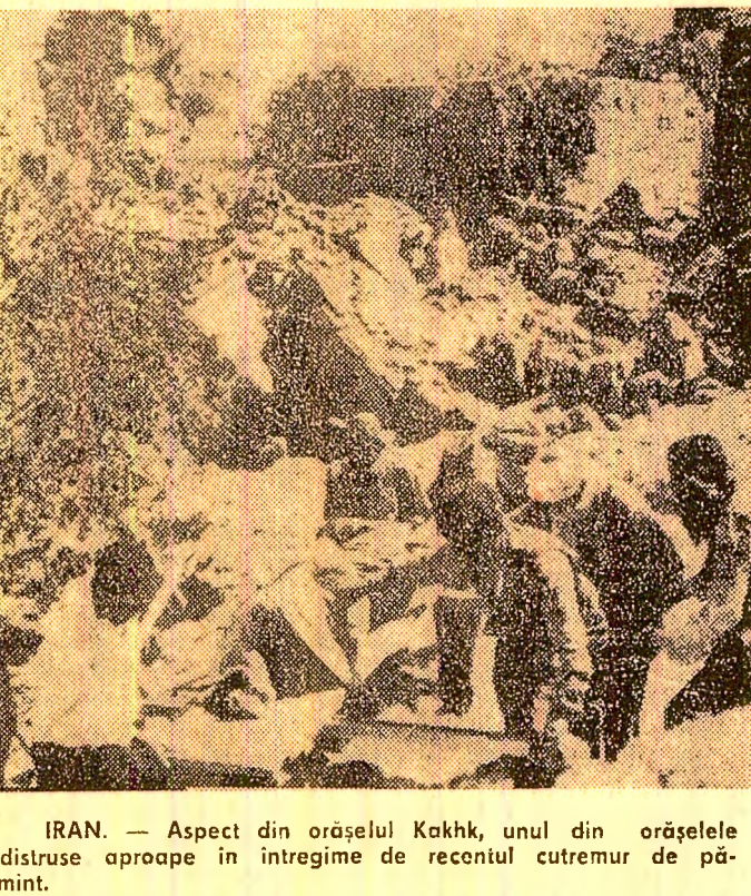
IRAN. — Aspect din orașul Kakhk, unul din orașele distruse aproape în întregime de recentul cutremur de pămînt.

Intr-o declarație publicată în presa portugheză de miercuri dimineață, medicul primului ministru Salazar a declarat că