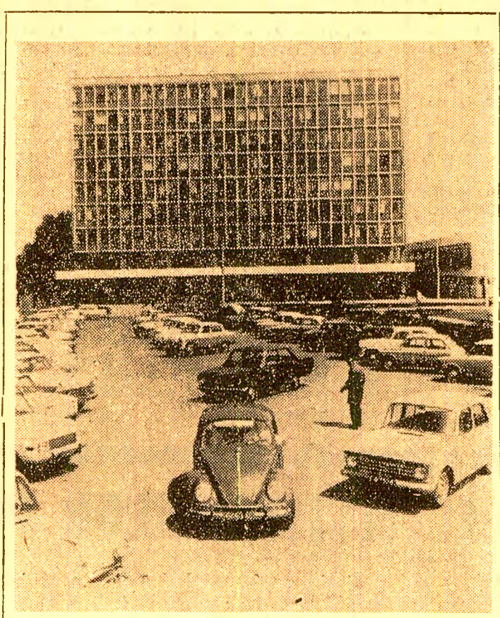
R.P. BULGARIA. — Vedere exterioră a unei noi unități industriale recent dată în funcțiune la Sofia — întreprinderea producătoare de utilaj pentru tăierea rapidă a metalelor.