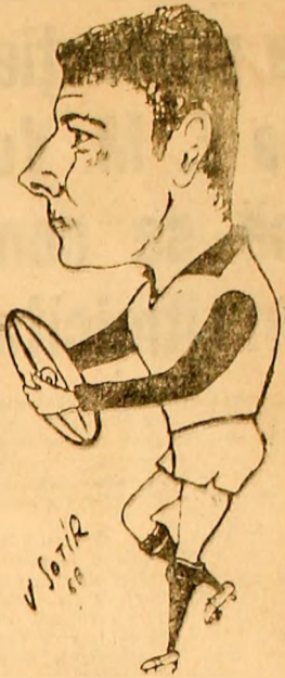
Săbău, unul dintre jucătorii da haza ai echipei de rugbi Știința, văzut de VASILE SOTIR.