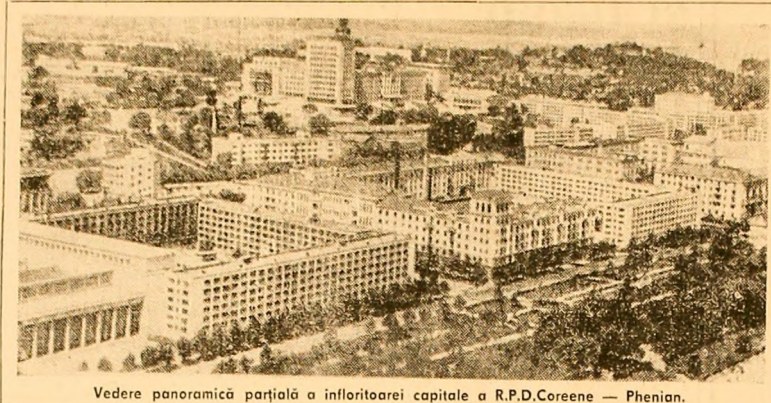
Vedere panoramică parțială a înfloritei capitale a R.P.D. Coreene — Phenian.

Luni, în cea de-a patra zi a șederii sale în Finlanda, delegația Marii Adunări Naționale a vizitat orașul Helsinki, renumit pentru arhitectura sa luminoasă, „orașul alb al Nordului”.