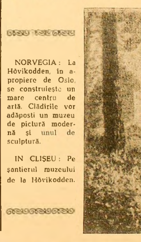
NORVEGIA: La Høvikodden, în apropiere de Oslo, se construiește un mare centru de artă. Clădirile vor adăposti un muzeu de pictură modernă și unul de sculptură.

KINGSTON 17 (Agerpres). — Unități ale poliției și armatei au patrutat în cursul nopții de miercuri pe străzile capitalei Insulei Jamaic, după demonstrațiile și tulburările care au avut loc în acest oraș. Tulburările au fost declanșate miercuri de demonstrațiile studenților de la „Universitatea Indiilor de vest” din Kingston. Poliția a intervenit pentru a împiedica pe demonstrații utilizînd gaze lacrimogene și operînd arestări. Unități ale armatei au fost aduse în prîjiniul poliției. În cursul tulburărilor care au urmat acțiunilor de reprimare, poliția și armata au deschis focul ucigînd o persoană. S-au înregistrat, de asemenea, mai mulți răniți, dintre care unul a fost internat la spitalul din Kingston.