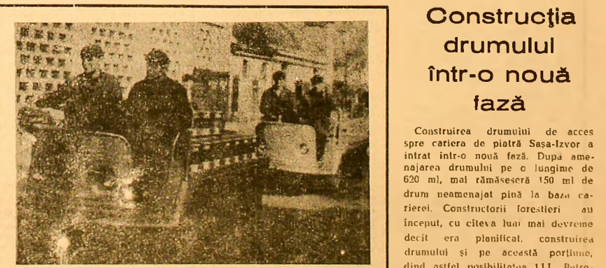
Electrocălele recent primite la U.R.U.M. Petroșani usurează transportul interior, între secții.