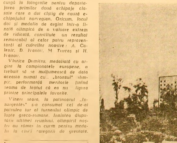
O frumoasă vedere din Ciudad de Mexico, orașul care concentrează astăzi atenția iubitorilor sportului.

După 13 zile de întreceri, în clasamentul pe medalii România ocupă locul 11 cu 4 medalii de aur, 1 de argint și 3 de bronz. Pe primul loc se află S.U.A. cu 40 medalii de aur, 26 de argint și 33 de bronz, urmăriți de U.R.S.S. (21-23-25), Ungaria (7-10-10) și Franța (7-1-5).