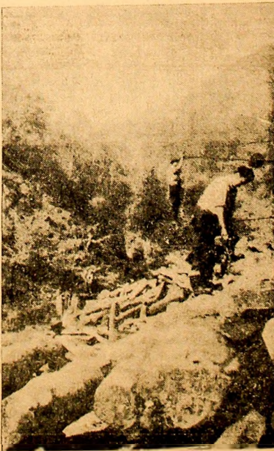
Aspect de muncă de la exploatarea forestieră Valea Mierleș, sectorul Lupeni.

Circumscripția nr. 4 funcționează în zilele de luni, miercuri și vineri, cu program de consultații între orele 7,30-19 și teren 12-14,30; în zilele de marți, joi, simbătă, cu consultații între orele 7,30-12 și teren 12-14,30. Populația din Isroni va fi deservită de către dispensarul din Aninoasa.