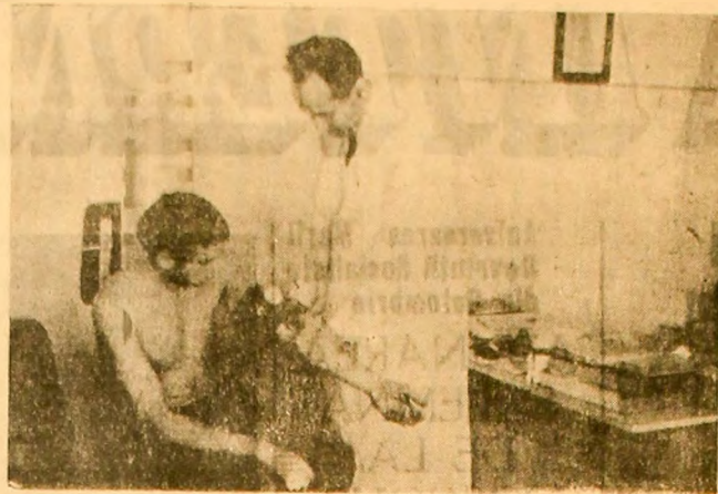
Consult medical la dispensarul Complexului C.F.R. Petroșani.

Este dorința unanimă a celor ce muncesc în industria carboniferă, este dorința epocii României socialiste.