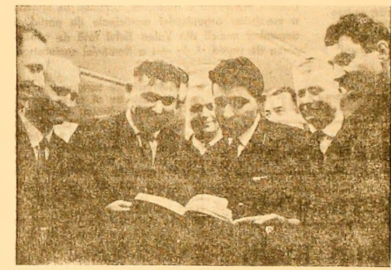
Într-o pauză a Conferinței, un grup de delegați de la E. M. Lupeni discută problemele la ordinea zilei.

de muncă să se desfășoare activități culturale și artistice de masă, să se popularizeze hotărîrile partidului și guvernului, explicînd clarviziunea și caracterul profund științific al politicii partidului, orientat just publicul în multitudinea faptelor și evenimentelor. Pentru antrenarea maselor la înlăpturii politice partidului, la cluburile sindicalelor s-a încercat cu succes permanentizarea unor acțiuni culturale variate, accesibile și îndrăgite de mase, cu mari efecte mobilizatoare (simpozion tematice, dezbateri publice a unor hotărîri ale partidului, brigăzi științifice etc.). Cultivarea dragostei de partid și menținerea în permanență a unui climat spiritual, în care patriotizmul să lumineze ca o flacără vesnic vie, a constituit o altă latură a preocupărilor cluburilor și cîmăndor culturale, în care scop manifestările culturale au reușit să îmbine sentimentul patriotizmului cu viața și munca de fiecare zi a oamenilor muncii. Avînd în vedere importanța cunoașterii continuei revoluții tehnico-științifice contemporane, spunea în conținutul cuvîntului său profesorul Cornel Hogman, unitățile culturale din municipiu s-au străduit ca prin bibliotecă, expoziții, manifestări culturale, să țină la curent oamenii mun-