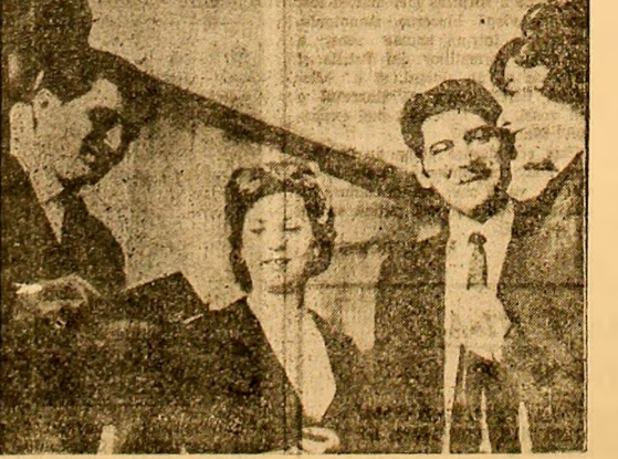
Delegații la conferință, într-una din pauze, în holul Casei de cultură.

Martori ai profundelor schimbări economice și sociale din municipiul nostru, cei peste 5000 de elevi și studenți constituie un detașament activ al tineretului generației. Ei reprezintă viitoarele cadre ale industriei și economiei noastre. De pregătirea acestora, de modul în care își acumulează cunoștințele de specialitate și sînt educați în spiritul dăruirii și pasiunii pentru muncă, depind însăși succesele de viitor ale bazinului carbonifer. La educarea tineretului studios un aport prețios îl aduce organizațiile U.T.C. care, sprijinînd în mod activ eforturile corporurilor profesionale, contribuie la însușirea de către elevi și studenți a cunoștințelor predate, la formarea lor politico-cetățenească.