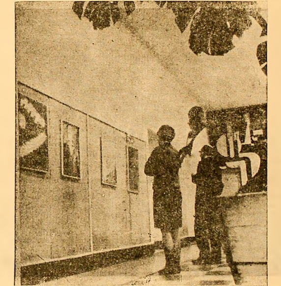
Un colț al expoziției de artă plastică a artiștilor amatori din Lupeni.

Rezultă că masa rotundă organizată la I. F. Petroșani pe tema rentabilizării întreprinderii a fost deosebit de utilă pentru orientarea activității ei economice în viitor. A reieșit că există posibilități largi ca, fără a apela la investiții, să se ajungă, prin soluții pur organizatorice, la rentabilizare și aceasta în cursul unui singur an.