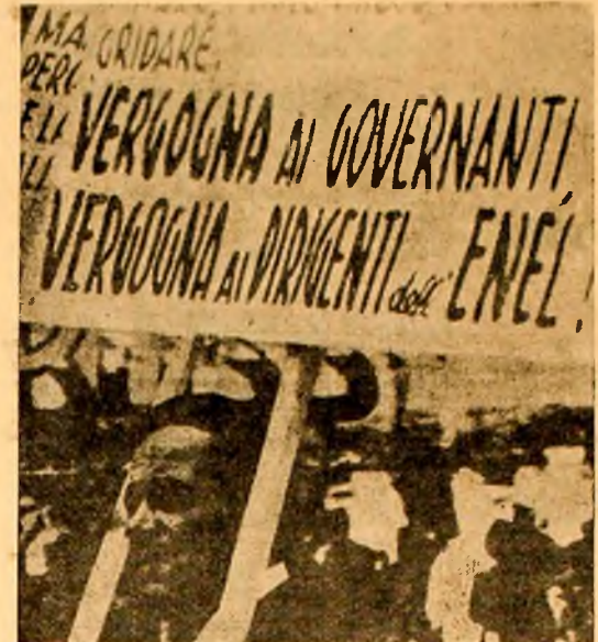
ITALIA: Aspect de la o recentă manifestație de protest a minerilor de la San Giovanni Valdarno, împotriva intențiilor patronatului de închidere parțială a exploărilor de lignit.

MOSCOVA 21 (Agerpres). — Andrei Gromiko, ministrul afacerilor externe al U.R.S.S., a plecat sâmbătă la Cairo, într-o scurtă vizită de prietenie, în cursul căreia, potrivit agenției TASS, se va face un schimb de păreri în probleme care interesează U.R.S.S. și R.A.U.