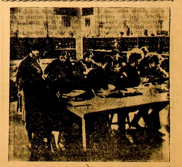
Institutul de mine Petroșani. Studenții ai anului I preparează o oră de laborator.

trebui institute tehnice și repartizate judicios în vederea împrumutării tuturor unităților comerciale, sanitare etc. Se impune să fie mai bine folosit clubul în scopul îmbunătățirii activității cultural-educative, iar aceasta să fie mai strîns legată de activitatea practică din întreprindere, să întărească îndeosebi înținerii disciplinii și aparierea avîntului obștec. Sarcinile importante puse în fața sindicatelor în ceea ce privește impunerea și necesitatea ridicarea calitativă a întregii activități prin îmbunătățirea stilului și metodelor de muncă, respectarea principiului muncii și conducerii colective, generalizarea experienței înaltate printr-o largă consultare a maselor. Îmi exprim convingerea — a arătat în încheierea cuvîntului său tov. Mihailă Gheorghe — că activul Consiliului municipal al sindicatelor Petroșani, toți membrii de sindicat, vor de țesura o muncă neobosită pentru înlăturarea sarcinilor stabilite de conducerea de partid și de stat.