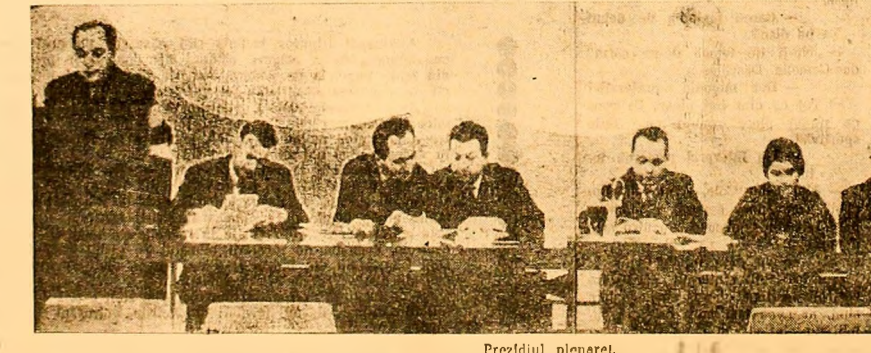
Prezidiul plenarei.

În perioada analizată în darea de seamă, peste 2.400 familii s-au mutat în locuințe noi, s-au construit 26 săli de clasă, un cîmin cu 300 de locuri la Grupul școlar minier din Petroșani, s-au dat în folosință 2.600 mp de spațiu comercial și alte obiective social-culturale. Prin comertul de stat s-au vîndut populației mîntor în valoare de peste 1,3 miliarde lei, iar pentru învățămînt, cultură, sîpătate și prevederi sociale s-au cheltuit mai bine de 112.000.000 lei. În perioada anilor 1967—1968 au fost trimiși la odihnă și tratament peste 10.000 de salariați. Cu o rază de control efectuate la cantine, băi, vestiare de către echipele de control obștec s-au făcut 168 propuneri.