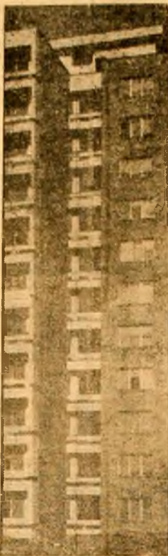
Unul din frumosele blocuri cu 10 etaje și 66 apartamente ridicate în Petroșani. Pînă acum, 9 asemenea blocuri înalte au fost date în folosință, iar al zecelea își va primi locatarii în trimestrul I al anului viitor.

Răspunzînd chemării organizației U.T.C., tinerii de la Preparația cărbunelui Coroști au amenajat în apropierea uzinei un patinoar. Inițiativa uteciștilor este laudabilă, deoarece patinoarul va satisface cerințele amatorilor sporturilor pe gheață din Vulcan care, pînă în prezent, nu au dispus de un teren amenajat corespunzător în acest scop. Nici uteciștii de la Liceul Lupeni nu s-au lăsat mai prejos. Mobilizați de comitetul U.T.C., tinerii au amenajat în parcul „6 August” din centrul orașului, un patinoar.