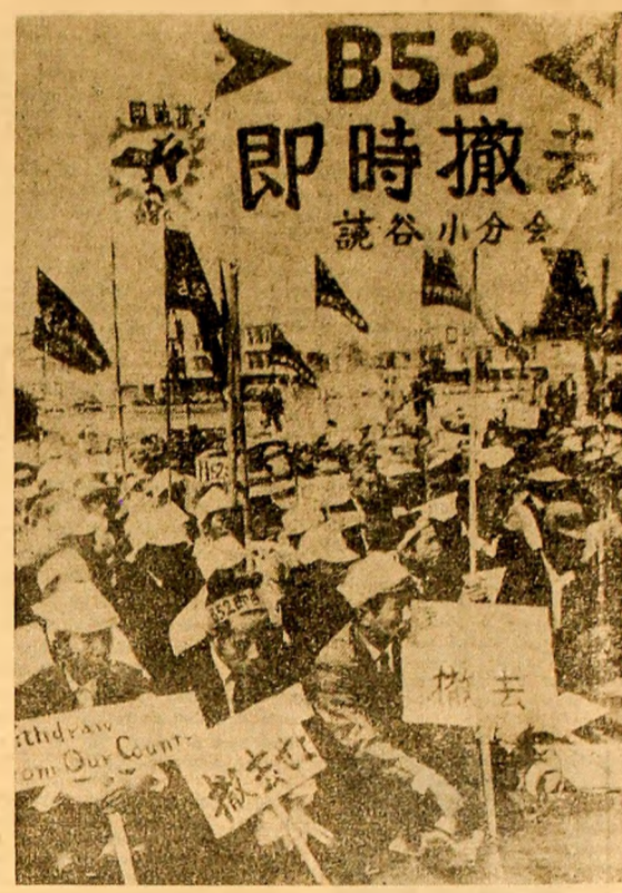
JAPONIA: Aspect din timpul marilor demonstrații a profesorilor la baza americană Kadena împotriva existenței pe teritoriul Okinawei a bombardierelor gigant tip „B-52”...