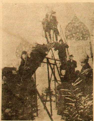
Unul după altul, copiii alunecă pe tobogan.

Virtuejul jocului și face pe micuți să uite de frigul iernii.