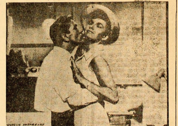
Norman Wisdom în „Veșnicul întirziat”.