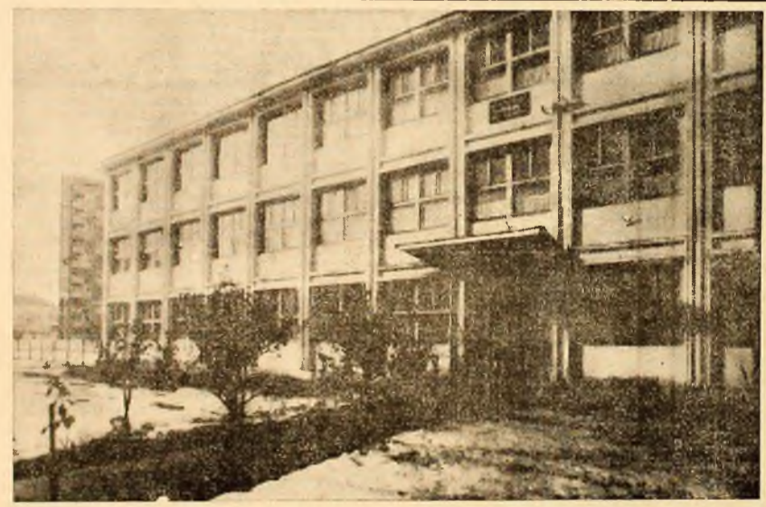
Liceul din Urzicani — principalul focar de cultură și civilizație din cel mai tînăr oraș al Văii Jiului.