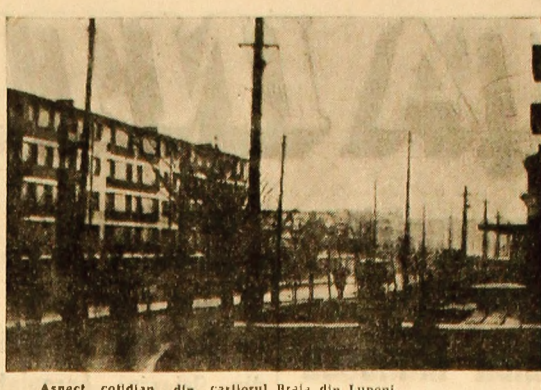
Aspect cotidian din carlierul Brala din Lupeni