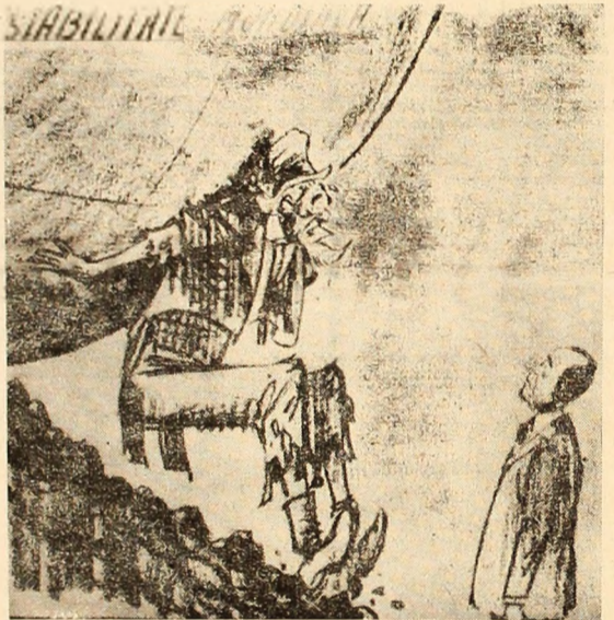
Prezentarea caricaturii a așa-numitei „stabilități mondiale” pe care a moștenit-o Administrația Nixon după opinia publicației americane „U.S. News”.

WASHINGTON 22 (Agerpres) — Președintele S.U.A., Richard Nixon, a prezidat marți prima reuniune a Consiliului Național de Securitate al S.U.A., sub noua administrație republicană. La întrunire au participat principalele oficialități guvernamentale — vicepreședintele Spiro Agnew, secretarul de stat, William Rogers, ministrul de finanțe, David Kennedy, ministrul apărării, Melvin Laird, directorul C.I.A., Richard Helms, președintele Comitetului mixt al senilor de stat major, generalul Earle Wheeler, șeful Oficiului pentru pregătiri în vederea situațiilor excepționale, și alți membri ai Consiliului. Referindu-se la componența și modalitatea de lucru a Consiliului,