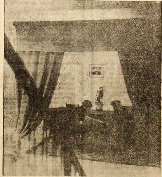
Holul ospitalier de la intrarea căminii constructorilor din Petroșani.

Adevărat, alt timp cit vor fi invocate doar pretenții și nu se va face nimic pentru crearea unui mediu familial peîncum vom lătmii mereu aspecte nedorite în căminele nefamiliașilor.