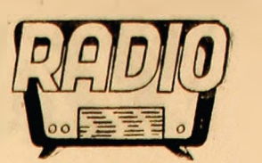
SIMBĂTA 25 IANUARIE