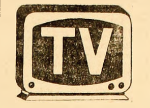
VINERI 24 IANUARIE

● Se vor construi 326 de apartamente ● se va da in folosință un complex comercial