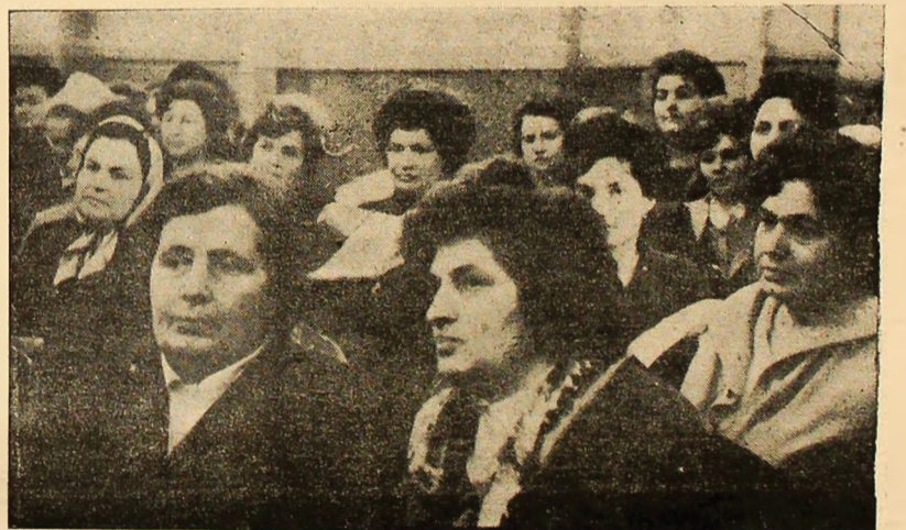
Aspect din sală, în timpul conferinței.