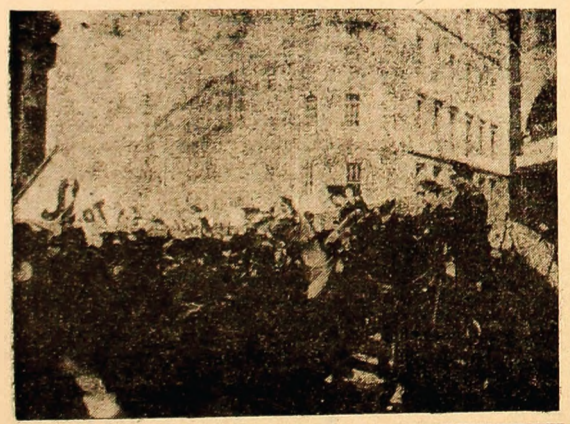
ANGLIA: Aspect din timpul unei recente demonstrații desfășurate la Londra, împotriva regimului rasist al lui Ian Smith în Rhodesia; s-au semnalat ciocniri violente între demonstrații și poliție.

LAGOS 30 (Agerpres). — Potrivit ultimelor zile transmise de postul de radio „Vocea Biaferei”, unitățile federale nigeriene ar fi organizat o puternică ofensivă în sectorul Abagana. Surse oficiale din Lagos au refuzat să confirme sau să demniteză știrea, dar corespondenții de presă menționează că generalul Hassan Usman Katsina, șeful de stat major al armatei federale, întreprinde în prezent o vizită în această parte a frontului. De asemenea, s-a apreciază că cea de-a doua divizie a armatei federale, recent înlătrită, ar putea să străpungă apărarea biaferească în sectorul Onitsha și să înclucă cu prima divizie în sectorul Abagana.