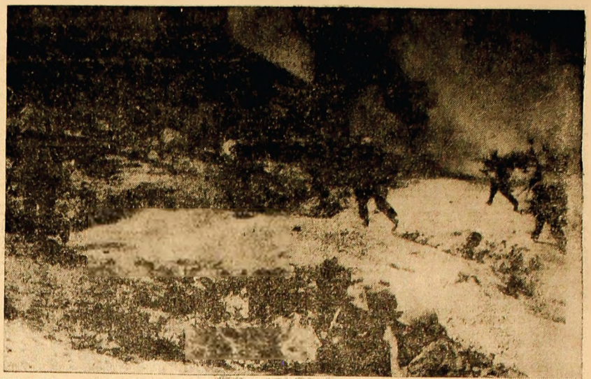
VIETNAMUL DE SUD: Paștrii sud-vietnamezi luptând în regiunea Quang Tri.

PARIS 30 — Corespondenții Agerpres, Georges Dascal, transmit Comitetul Executiv al Partidului Comunist din Spania a dat publicității o declarație în care condamnă hotărârea guvernului spaniol de a instala în țară starea excepțională. Cercurile cele mai extremiste ale regimului — se spune în declarație — încearcă să oprească lupta clasei muncitoare împotriva scăderii nivelului de trai, a condițiilor tot mai grele de muncă și pentru libertăți sindicale și politice. Comitetul Executiv al Partidului Comunist din Spania cheamă masele largi să lupte cu mai multă energie și hotărâre împotriva stării excepționale pentru punerea în libertate a delinșilor politici, încetarea represaliilor. De asemenea, este adresată tuturor partidelor comuniste frățești, tuturor forțelor progresiste și democratice din lume chemarea de a se solidariza cu lupta poporului spaniol.