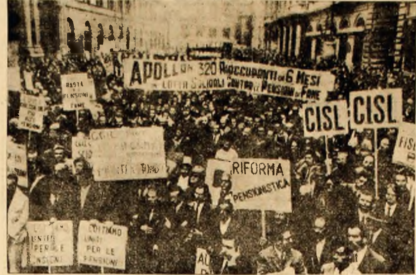
ITALIA: Aspect surprins în timpul acțiunilor greviste de protest ale muncitorilor. IN CLISEU: O puternică manifestație pe una din străzile Romei.

ROMA 5. — Corespondentul Agerpres, N. Pulcea, transmite: Miercuri s-a deslășurat cu succes, în întreaga Italia, greva generală a oamenilor muncii din industrie, comerț și agricultură. Ea a fost declarată marți noaptea pe timp de 24 de ore, în semn de protest față de nerealizarea unui acord între guvern și sindicate privind îmbunătățirea sistemului de pensionare și majorarea pensiilor. Grevai s-au alăturat și lucrătorii din porturi, serviciile auxiliare din transporturi, din tipografiile ziarelor, din teatre și cinematografe. În semn de solidaritate, au declarat greve pe timp limitat și lucrătorii de la aeroproșuri, telefoane, apă și electricitate, de la poștă, soferii taximetrelor și salariații de la transporturile vâșnești etc. Într-un puternic spirit de unitate de clasă, aproximativ 18 milioane de oameni ai muncii au încetat lucrul, paralizînd practic întreaga activitate productivă. În principalele orașe ale Italiei, au avut loc demonstrații și mitinguri, în cadrul cărora vorbitorii au scos în evidență cauzele grevei și poziția susținută de sindicate la tratativele cu guvernul. Cu toate că s-au făcut unii pași în direcția justă — au menționat vorbitorii — „lipsește încă angajamente concrete din partea guvernului, iar cele asumate sînt insuficiente”. La Roma mii și mii de oameni ai muncii au demonstrat pe străzile centrale ale capitalei, purtînd lozinci și pancarte în sprijinul revendicărilor lor.