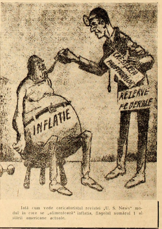
Iată cum vede caricaturistul revistei „U. S. News” modul în care se „alimentează” inflația, flagelul numărul 1 al stării americane actuale.

WASHINGTON 7 (Agerpres). — În urma intensificării protestelor opiniei publice americane și a congresmenilor, ministrul apărării al S.U.A., Melvin Laird, a anunțat că a ordonat sistarea unor lucrări care urmau să fie executate în cadrul programului de construire a sistemului antirachetă „Sentinel” pînă la definitivarea revizuirii bugetului militar al S.U.A. Hotărîrea a fost dată publicității după ce ministrul apărării a primit o scrisoare din partea președintelui Comisiei Camerei Reprezentanților pentru serviciile armatei Mendel Rivers, prin care i se aducea la cunoștință că acest organism a hotărît să nu mai aprobe nici o construcție în cadrul programului „Sentinel”, pînă cînd administrația Nixon nu-și va preciza poziția față de acest program care costă 5 miliarde dolari. Comisia, prezidată de Rivers, urmează să aprobe selecționarea locurilor pentru instalarea dispozitivelor de lansare a rachetelor antirachetă, precum și fondurile necesare acestor lucrări.