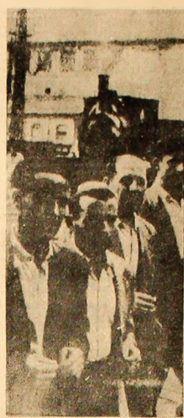
SPANIA. — Unul din aspectele luptii antiguvernamentale a populației spaniole dezlănțuite de instaurarea recentă a stării excepționale la Uzinele siderurgice Allos hornos din Bilbao, peste 12.000 de muncitori au declarat grevă după arestarea unui lider sindical.

NEW YORK 13 (Agerpres). — La sediul O.N.U. au continuat miercuri consultările bilaterale preliminare între reprezentanții celor patru mari