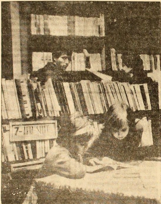
Într-o obișnuită zi de lucru, la biblioteca clubului din Vulcan.

Activitatea cultural-educativă de masă ce se desfășoară în Valea Jiului, prim amploarea și conținutul ei, își aduce din plin contribuția la fâcirea unei om nou, participant activ și conștient la opera de desăvîșire a construcției socializmaului.