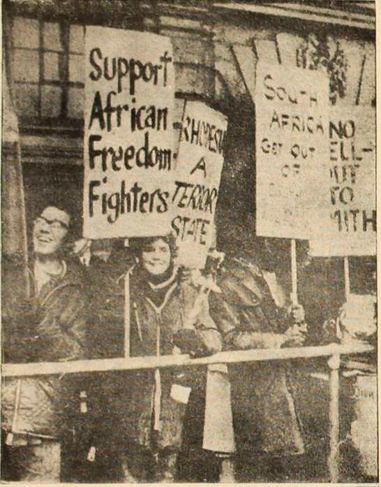
ANGLIA: — Aspect din timpul marilor demonstrații împotriva regimului rasist al lui Ian Smith, desfășurate recent la Londra.

BONN 14 (Agerpres). Convorbirile dintre premierul Wilson și cancelarul Kiesinger s-au încheiat fără anunțarea vreunei hotărîri importante. Se relatează că premierul britanic și cancelarul german au convenit ca problemele referitoare la tratatul de neproliferare a armelor nucleare, pe care R.F. a Germaniei nu l-a semnat încă, să fie discutate în cursul unor viitoare contacte bilaterale; ceea ce indică în mod clar că punctele de vedere ale celor doi interlocutori au rămas divergente.