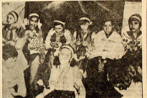
Frumoasele costume naționale dau un aspect deosebit șezătoarei literare a elevilor.

Dumnezeu și cîntecul La oglindă și Numai una, îmbrăcați în frumoase costume naționale, pionierii au ascultat apoi momente semnificative din viața poetului.