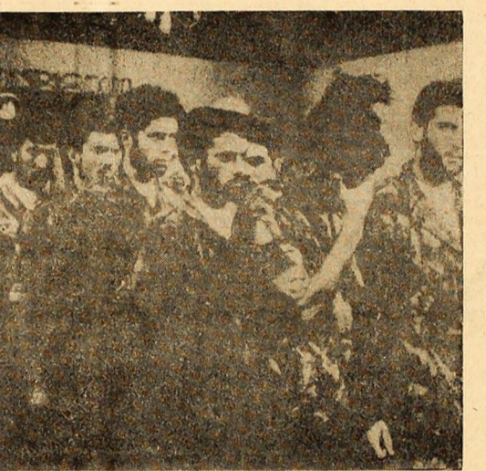
ANGOLA: Prizonieri capturați recent de patrioții angolezi din rîndul trupelor colonialiste portugheze.

În baza propunerilor făcute de președintele Nixon, organismul guvernamental însărcinat să înlăunșeze acest program ar trebui să se transforme într-un minister pentru problemele sărăciilor. În acest mesaj, primul consacrat unei probleme interne, de interes major, președintele Nixon a subliniat că în Statele Unite sărăcia afectează în special pe oamenii de culoare, care reprezintă aproximativ 12 la sută din totalul populației.