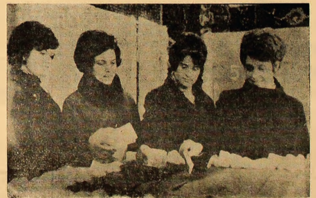
Patru eleve din clasa a XII-a de la liceul din Vulcan la primul lor vot. Încă un amănunt. Secția de votare se află chiar la liceul în care învață și care a fost dat în folosință în toamna anului trecut.