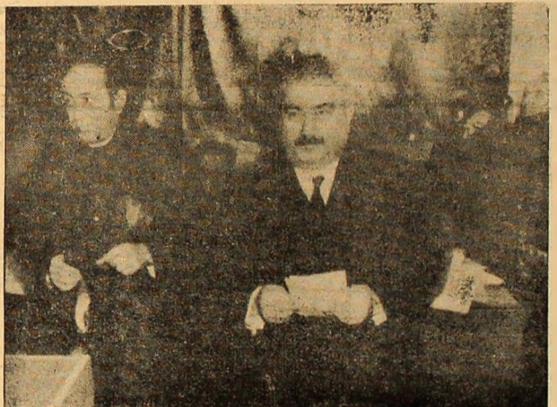
Votează cadre din conducerea Institutului de mine.