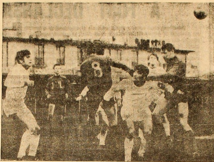
O fază care „vorbește” clar despre marea înclătare...