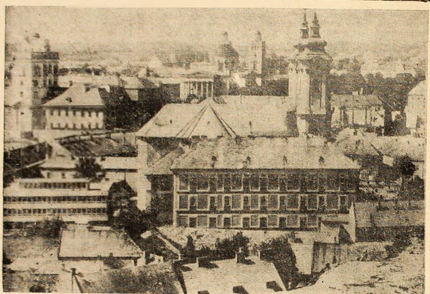
R. P. UNGARĂ: Vedere panoramică a orașului Eger din nordul Ungariei.