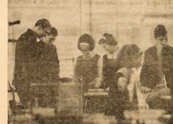
Oră de fizică în laboratorul Liceului din Vulcan.

de divizia B dintre I.M. Petroșani — Metalul Turnu Severin. ● Valeabilii de la Știința Petroșani își dispută victoria, în meciul de divizia B cu I.M.F. București. Ora începerii „ostilităților” — 10, terenul „bătăliei” — sala de sport I.M.P. ● Campionatul municipal de tenis de masă, pe echipe, continuă cu etapa IV-a. Se dispută următoarele întîlniri: Voinea Petroșani — Jui Petrila; Școala sportivă Petroșani — Minerul Lupeni; Minerul Vulcan — Liceul Industrial Petroșani; Energia Petroșani — Viscoza Lupeni.