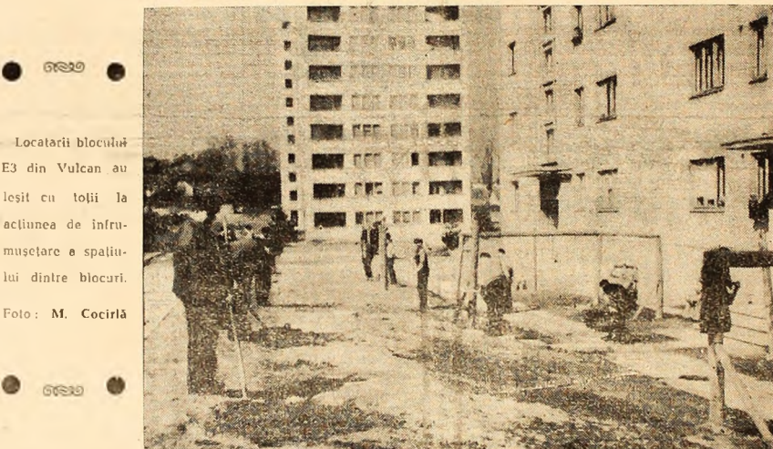
Localitățile blocului E3 din Vulcan au loșit cu toții la acțiunea de înfrumusețare a spațiului dintre blocuri.

De la Lonea pînă la Petrița nu-i decît un pas. Se pare, după cele văzute, că grija Consiliului popular al orașului este îndreptată mai mult către cartierul Petriței. Desigur a-aceasta nu-i decît o părere care, în zilele ce urmează, poate fi infirmată, dar numai prin fapte.