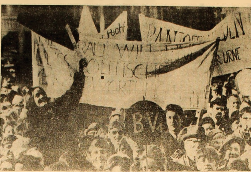
ELVEȚIA: Aspect din timpul unei demonstrații destășurate recent la Berna în semn de protest față de neparticiparea Fellmoller la viața politică.

nord de orașul Tay Ninh, într-o regiune acoperită de junglă. În cursul luptelor, care au durat șapte ore — relatează corespondentul agenției France Presse — a intervenit și artileria americană. Ambele părți au suferit pierderi. Luni seara și marți dimineața, „fortărețele zburătoare” americane „B-52” au efectuat noi raiduri în împrejurimile localității Dau Tieng, precum și în provincia Long Khanh.