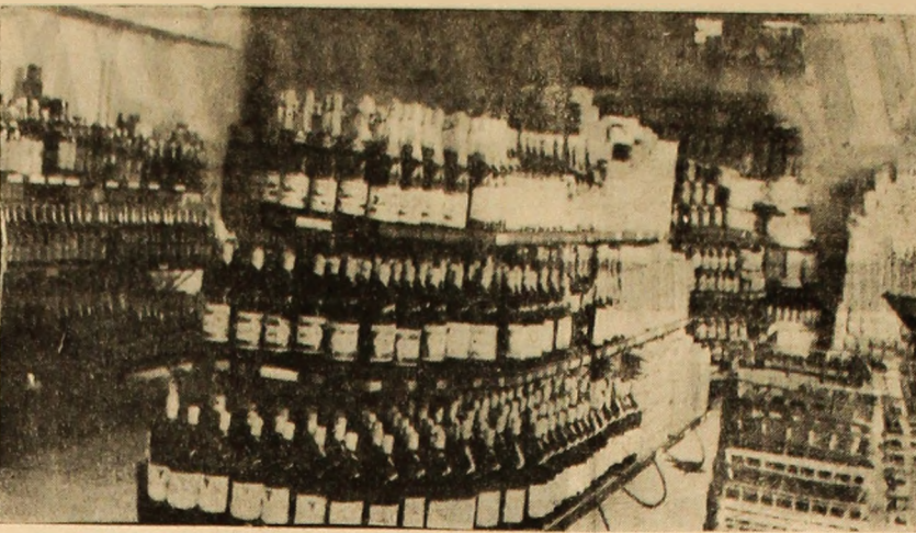
Aspect din magazinul alimentar deschis de curînd în noul complex comercial din orașul Vulcan.

Nu trebuie să uităm că simțim antrenat în întrecerea pe țară pentru cel mai frumos și mai bine gospodărit oraș și municipiu, că în sesiunea din ianuarie a.c. a consiliului popular municipal, am răspuns prin obiective concrete, la chemarea consiliului popular județean, pentru a întîmplina împlinirea unui stert de veac de la eliberarea României de sub jugul fascist și cel de-al X-lea Congres al P.C.R. cu rezultate deosebite în toate domeniile de activitate, inclusiv acela al gospodăririi și înfrumusețării exemplare a municipiului nostru.