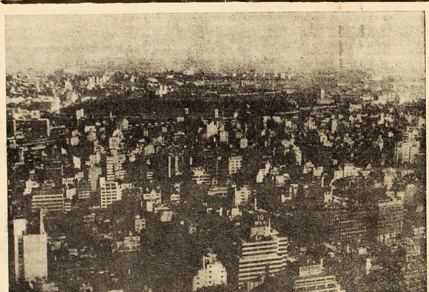
Vedere din „orașul crizantemelor” — Tokio, marea metropolă a Japoniei