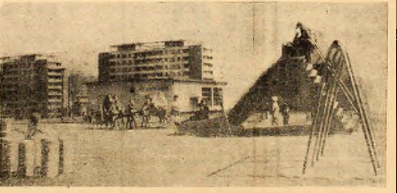
E iarăși primăvară. O simț și copiii din cartierul Coarcești — Vulcan, ieșiți în număr mare la joacă.

Filiala Timișoara, a Automobil clubului român, a organizat ieri și astăzi „Raliul Banatului” la care participă aproximativ 80 de echipe. Din Petroșani concurează echipajul compus din Alexandru Roseanu și Eugen Biră pe o mașină „Dacia 1100”. Azi dimineață participanții la raliu au trecut prin orașul nostru.