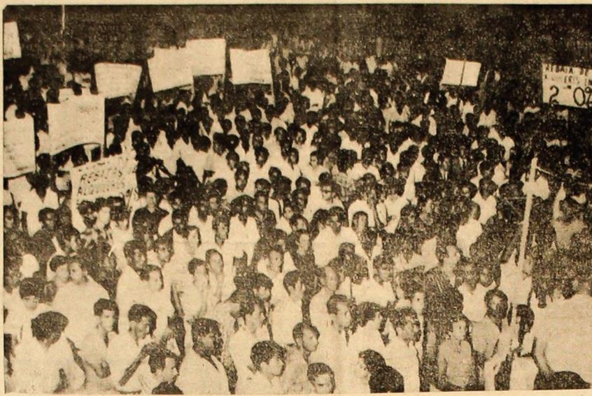
ECUADOR: Aspecte de la o grandioasă demonstrație desfășurată recent într-unul din principalele orașe ecuatorene Guayaquil; printre revendicările demonstranților se numără: îmbunătățirea condițiilor de muncă și viață, mărirea salariilor, naționalizarea instalațiilor petrolifere, lichidarea pozițiilor monopolurilor nord-americane în economia țării.