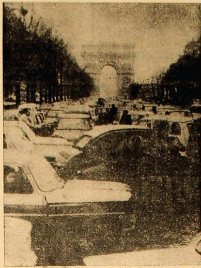
FRANȚA: Vedere de pe Champs Elysees, cu traficul blocat în timpul grevei generale organizată recent de sindicatele franceze; se știe că transporturile au fost afectate în proporție de 80-100 la sută.

PHENIAN 19 (Agerpres). — Ziarul „Nodon Simin” a publicat un articol de fond în care se arată că, în ultimul timp, S.U.A. își intensifică acțiunile militare împotriva R.P.D. Coreene. La 15 aprilie, ele au săvârșit o provocare în zona liniei militare de demarcație și, concomitent, au trimis un avion spion, însoțit de aparatul modern, adică în spațiul aerian al părții de nord a republicii. După cum se știe, acest avion spion a fost interceptat și doborât de forțele aeriene ale R.P.D. Coreene.