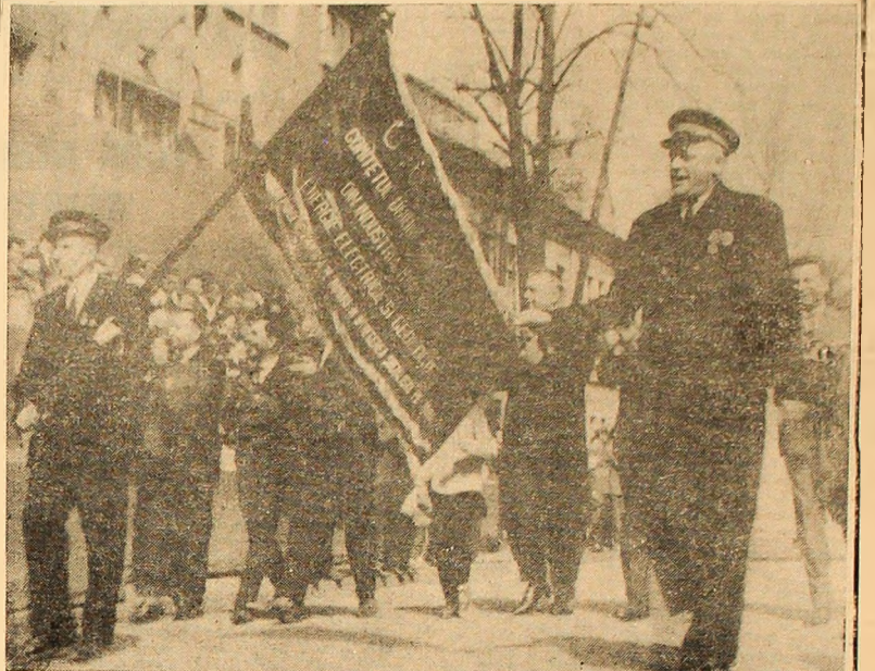
Harnicii mineri de la Lupeni au prezentat o frumoasă salbă de succese, incununate cu cea mai elocventă dovadă a strădanilor lor: drapelul de unitate frunțoasă de ramură.