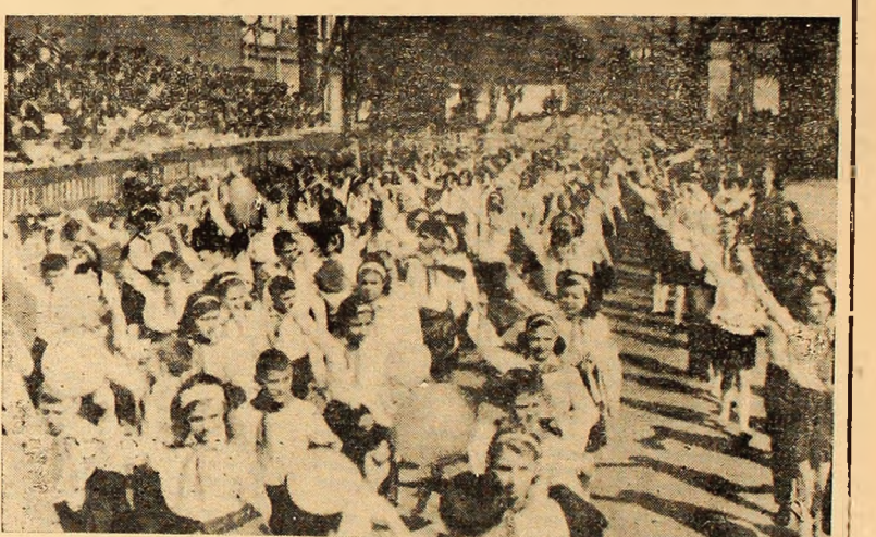
Revărsare de tinerete, entuziasm, de draoaste față de patrie și partid.