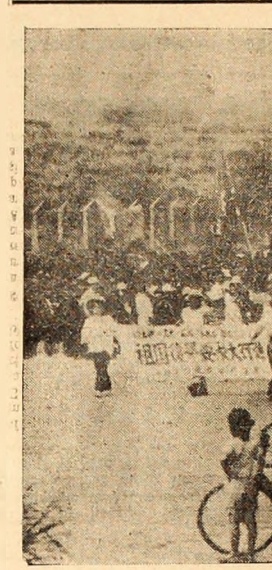
JAPONIA: Aspect din timpul unei recente demonstrații organizate la Okinawa pentru retrocedarea insulei la Japonia. Acțiunea organizată în cadrul marilor ofensive de primăvară a muncitorilor japonezi.