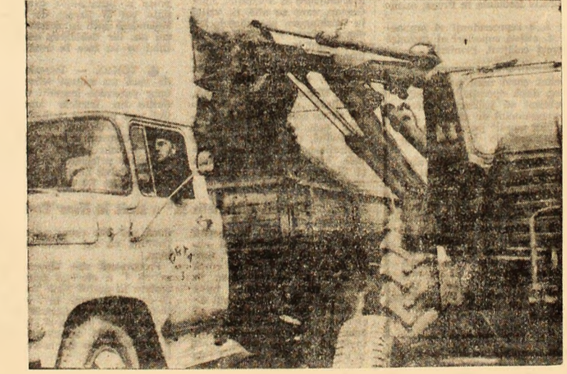
Caii-putere inlocuiesc sute de lopeți.