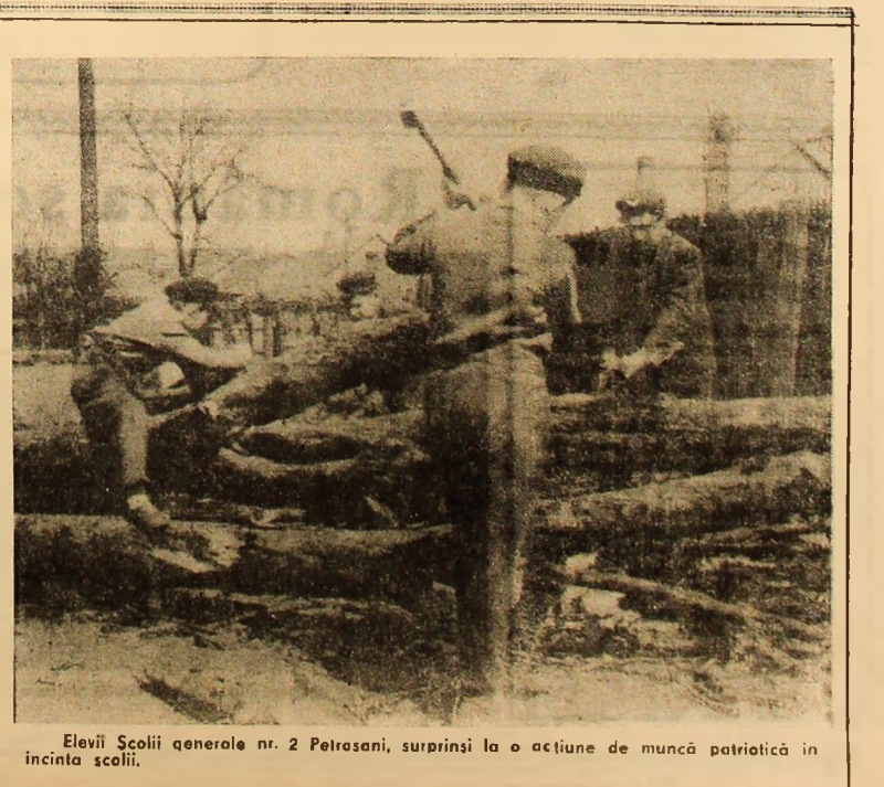
Elevii Școlii generale nr. 2 Petrosani, surprinși la o acțiune de muncă patriotică în incinta școlii.

Din discuțiile purtate, din faptele consemnate, din analiza realizărilor, rezultă că șantierul Fabricii de brichete Coroști „merge” în general bine, că acest colectiv harnic s-a mobilizat astfel încît a reușit, prin eforturi sporite, să lichideze rămînire în urmă din trimestrul I, și mai mult, să se situeze la unel lu-