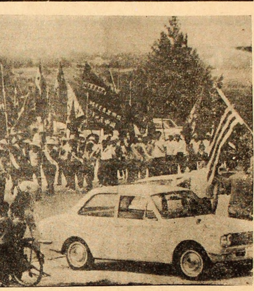
JAPONIA: Aspect din timpul unei recente demonstrații organizate la Okinawa pentru retrocedarea insulei la Japonia. Acțiunea organizată în cadrul marilor ofensive de primăvară a muncitorilor japonezi.

LONDRA 8 (Agerpres). — Cursul lirei sterline a continuat să scadă și joi pe piața valorilor din Londra în urma zvonurilor persistente privind o reevaluare a mărcii vest-germane. Ea a fost cotată joi la 2,3625 dolari, cu șapte puncte mai puțin decît în ziua precedentă. Banca Angliei a fost nevoită să