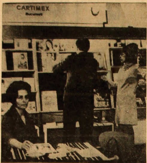
R. P. POLONA: Vizitatori în standul românesc la ediția din acest an a Tîrgului internațional al cărții de la Varșovia.