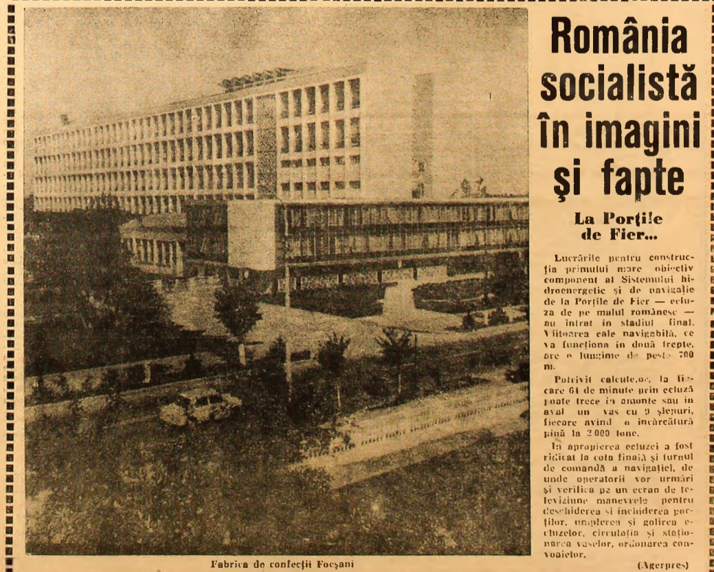
Fabrica de confecții Foșani