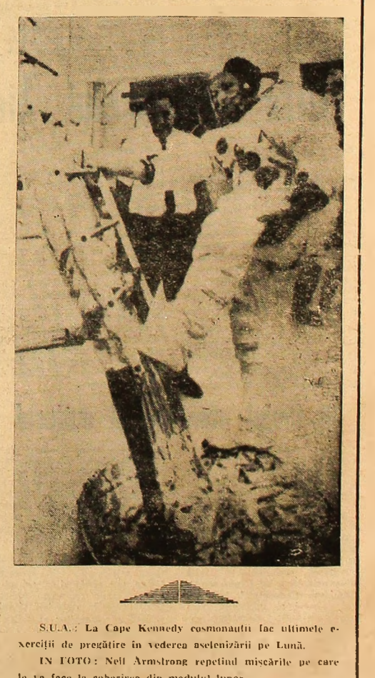
S.U.A.: La Cape Kennedy cosmonauții fac ultimele exerciții de pregătire în vederea aselenizării pe Lună. ÎN FOTO: Neil Armstrong repetînd mișcările pe care le va face la coborîrea din modulul lunar.