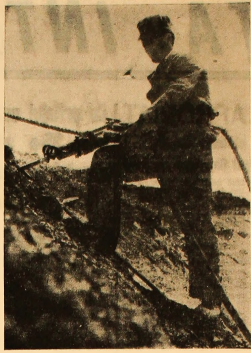
La cariera Bănița se pregătește o nouă puscătură.